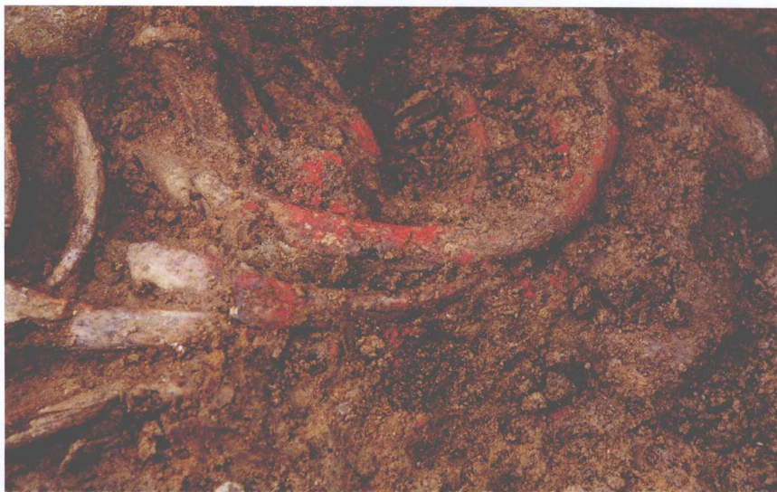
M118墓主身上朱砂痕迹 Traces of Cinnabar on the Tomb-owner's Body in Tomb M118

第八段墓葬以M136等为代表，主要分布在Ⅱ区墓地的西南角。随葬器物以灰陶为主，黑陶的