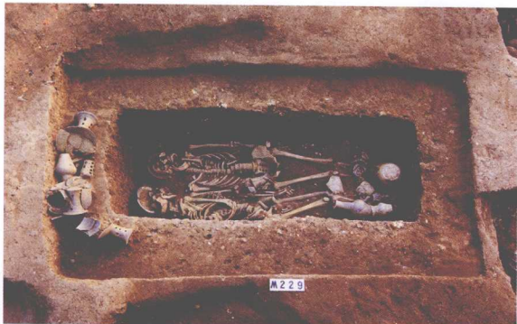
M229 Tomb M229