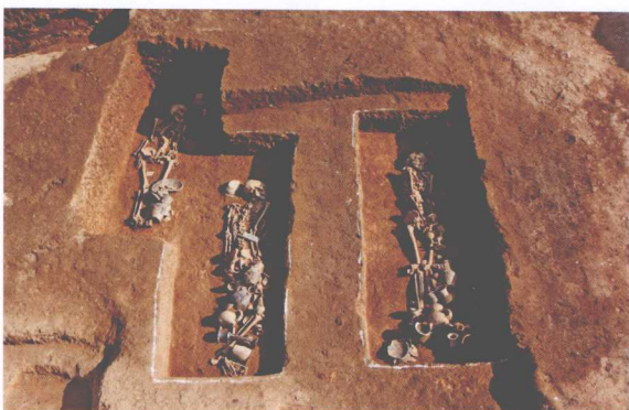
M225、M226、M238 Tombs M225, M226 and M238