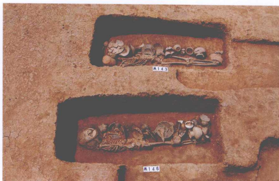
M143、M146 Tombs M143 and M146