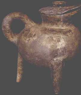
M204出土陶盃 Pottery He Tripod from Tomb M204