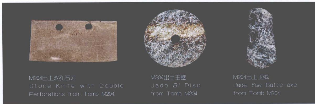
M204出土双孔石刀 Stone Knife with Double Perforations from Tomb M204