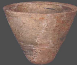
M204出土陶大口尊 Large-mouthed Pottery Zun Vase from Tomb M204