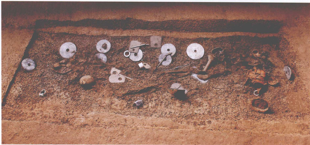
M204随葬器物出土情况