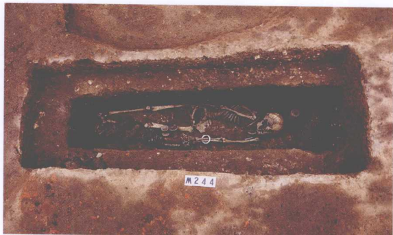
M244 Tomb M244