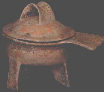
M204出土陶鼎 Pottery Ding Tripod from Tomb M204