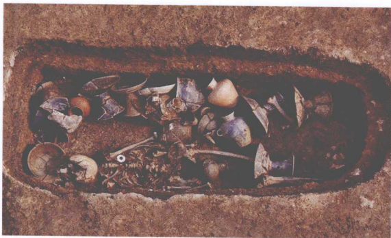
M110随葬器物出土情况 Funeral Objects of Tomb M110 in Excavation