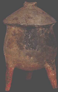
M204出土陶甗 Pottery Yan Steamer from Tomb M204