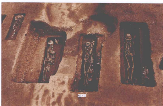
M242及其他墓葬 Tomb M242 and Other Burials

陶棺葬是长方形土坑竖穴墓，以陶器为葬具，一般是把陶器打碎后在墓底铺上一层陶片，然后放置墓主，接着在墓主身上再覆盖一层陶片。墓主有成人和儿童，以儿童为多。