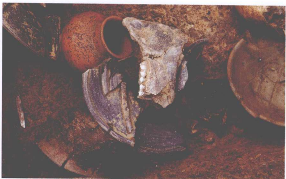
M110陶豆内猪下颌骨 Pig's Mandible in a Pottery Dou Stemmed Vessel of Tomb M110

出土陶罐的口沿及腹部有大片的朱红色；M110出土陶豆及陶罐上均有朱红色痕迹；M118墓主人右侧肋骨上有较大面积的朱红色痕迹，该墓出土的一件陶罐上亦有朱红色痕迹。无论器物还是人骨架上出现的朱红色痕迹的颜色、成分均一致。