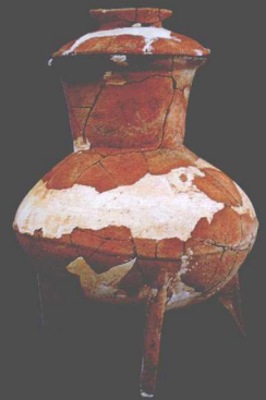
M204出土陶鬲 Pottery Gui Tripod from Tomb M204

In December 2008 to April 2009, the Archaeology Department, Shanghai Museum carried out excavation near the Fuquanshan mound within the Fuquanshan site at Chonggu Town in Qingpu District, Shanghai City, which brought about a still more distinct understanding of the current condition of the site and clarified the distribution limits of ancient cultural remains on the site. It has been known that the site features a great chronological span, a long continuity of function, a wide variety of vestiges and a great abundance of remaining objects. The most significant result is the discovery of an earth-built terrace with large-sized high-rank noblemen tombs of the late Liangzhu culture. The terrace lies at Wujiachang of Huilong Village