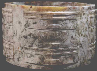
M204出土玉琮 Jade Cong Emblem from Tomb M204