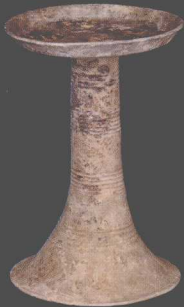
M204出土陶豆 Pottery Dou Stemmed Vessel from Tomb M204