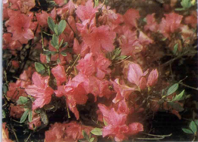
↑ Fire Light