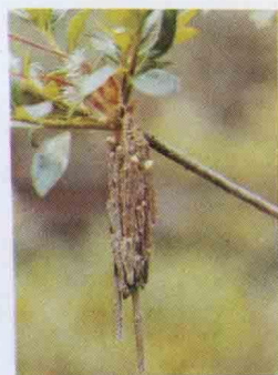
避債蛾（蓑衣蟲） 群集現象