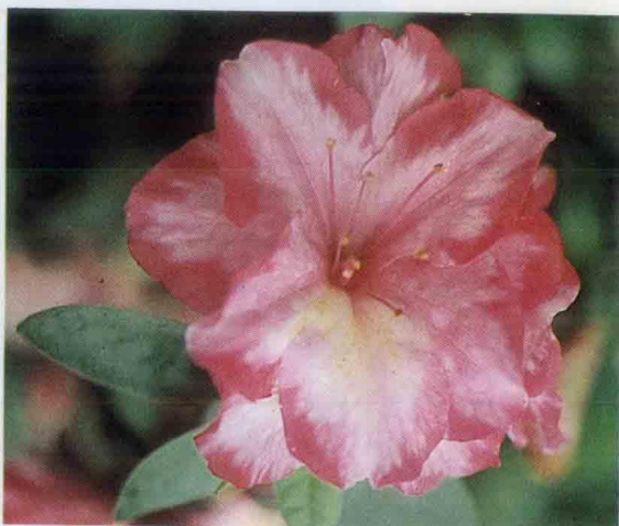
↑ Gay Paree