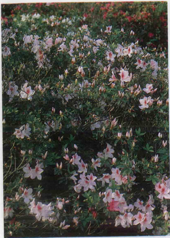
↑柳葉杜鵑（烏來杜鵑）