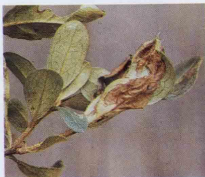
捲葉蟲之為害情形