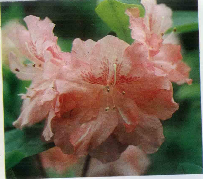
↑ N.Pink Bubble