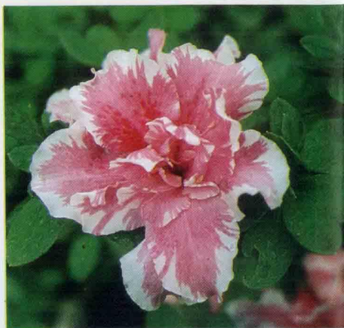
↑ Inga Vroag