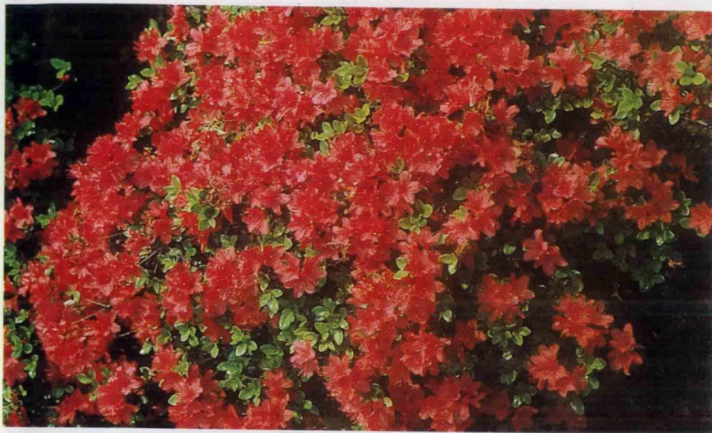
↑ Hino Crimson