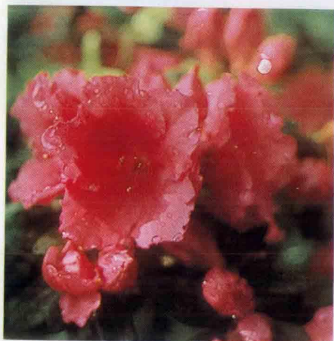
↑ Red Bird