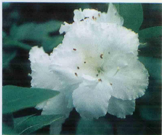
↑ N Masterpiece