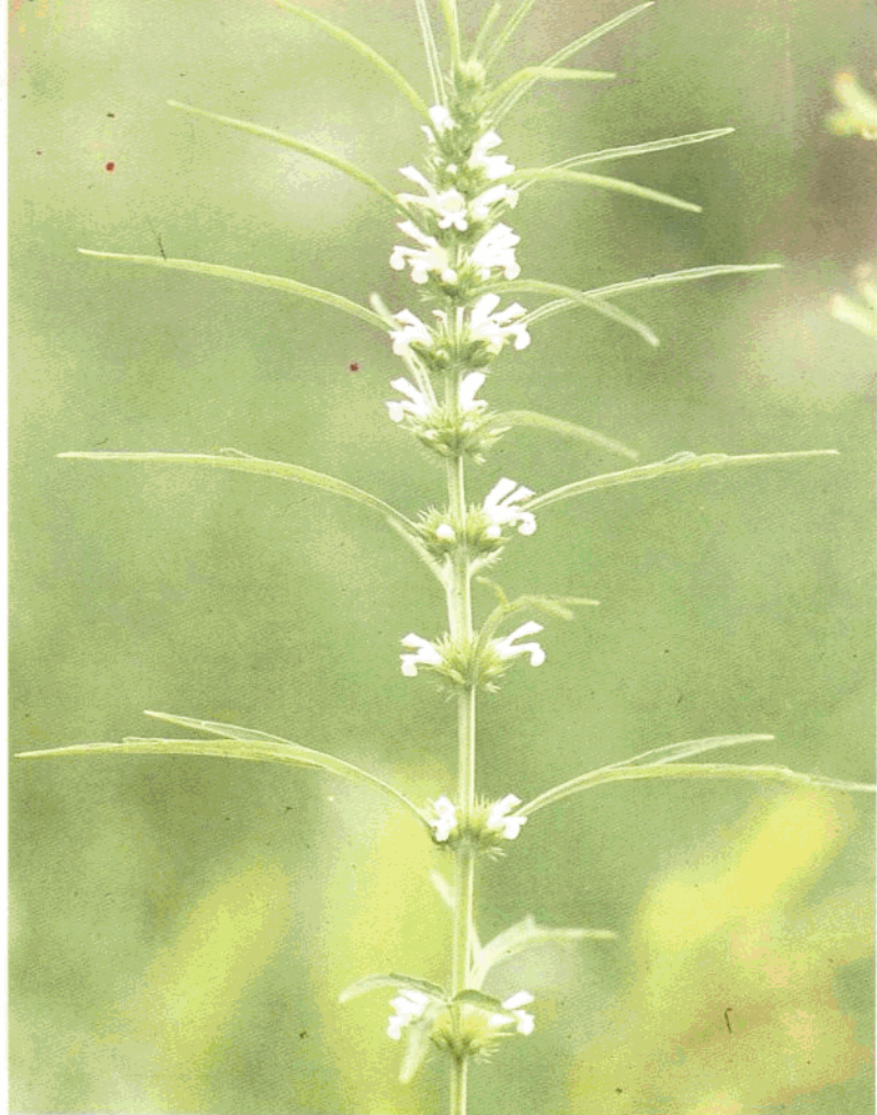
白 花 益 母 草

Leonurus sibiricus L. f. albiflora (Miq.) Hsieh