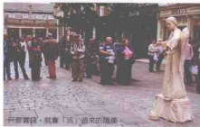
舞蹈表演 + 观众 + 步行者 + 出租车