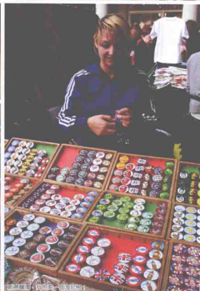
纽扣展示 + 步行者 + 出租车