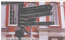
伦敦交通博物馆 + 博物馆 + 步行者