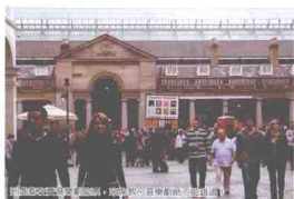
熙熙攘攘的伦敦街景 + 步行者 + 自行车 + 出租车