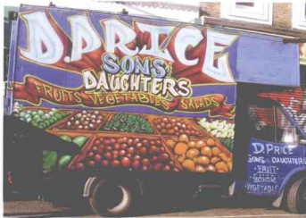
就連販水果的貨車，外觀裝飾也不能马虎！