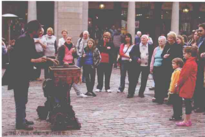
街头艺人表演 + 观众 + 步行者 + 出租车