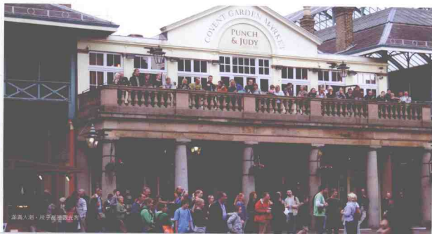
攝人眼，片字能透視光亦行

註：科芬園 (Covent Garden) 電影「窈窕淑女」中奧黛麗赫本賣花的市場就在此。