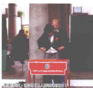
在伦敦，每年都要举行一次马拉松