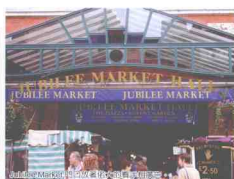
伦敦市场 + 步行者 + 自行车 + 出租车