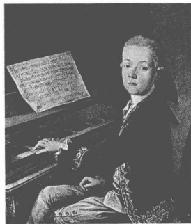
▲音乐神童莫扎特。据说孩提时代的他，在维也纳皇宫表演时遇到美丽小公主安托瓦内特，惊为天人，竟一板一眼宣布说：“我以后会娶你的。”