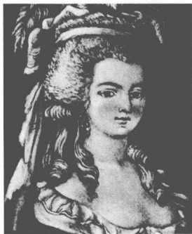
▲少女时代的安托瓦内特。

但是，两国的外交官都擅长把简单的事情复杂化，并且深以此为豪。接下来的三年，这件刚有头绪的婚事因为拖沓的外交谈判而裹足不前，没有丝毫进展。由于和国事息息相关，泰莉莎非常忧心。她通过各种途径，努力让自己女儿的美貌和美德在巴黎家喻户晓。她不惜重金买通使臣，以热切、友好也不乏狡猾的态度督促法国王室早日作出明确的决定。虽然传闻法国王储愚钝粗俗——造物主对此显然没有有所偏袒，但是女皇不以为然。在她看来，一位公主最大的幸福，就是成为王后。何况，她的身份，首先是奥地利的女皇，其次才是公主的母亲。国家命运和家族权势，显然比一个女儿的幸福更为重要。但是，她越是焦虑，路易十五就越是不急于表态。虽然三年来，他看了无数次奥地利公主的美丽画像，读了无数篇赞美她的文章；虽然他一向宣称自己乐于促成这门婚事，但事情仍旧被无限期地拖延了下去。