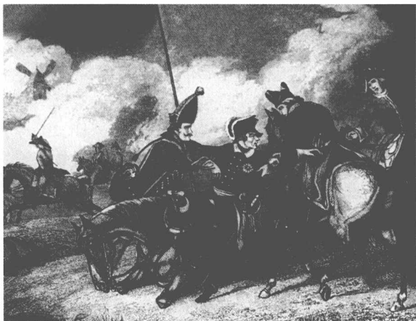
▲奔突于“七年战争”中的普鲁士国王腓特烈大帝。

越过国境线之后，公主必须完全法国化。礼节规定她的衣着鞋袜都必须出自法国工匠，一切来自奥地利的首饰，哪怕是一粒扣子，一枚别针，都不能留下。这代表着公主与过去熟悉生活的诀别。她换上来自巴黎、里昂的法国服装，由男宾相牵引着，被交付到法国人手里。这一刻，钟声长响，礼炮齐鸣，处处欢呼雀跃。没有人注意——即使注意也被掩盖忽略——