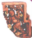
图 · 文 · 珍 · 藏