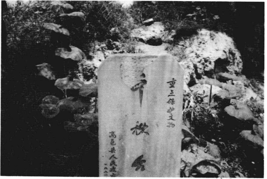
光武帝刘秀登基处 古千秋台遗址