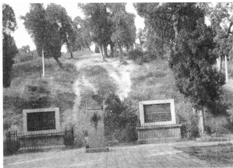
洛阳孟津汉光武帝园陵近景