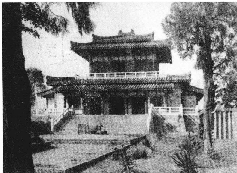
汉光武祠大殿（1993年重建）