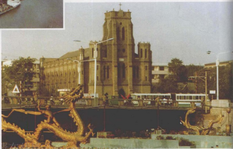
望海楼遗址