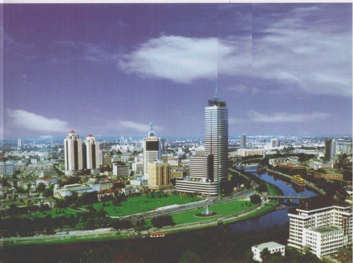
天津市新貌 包静摄