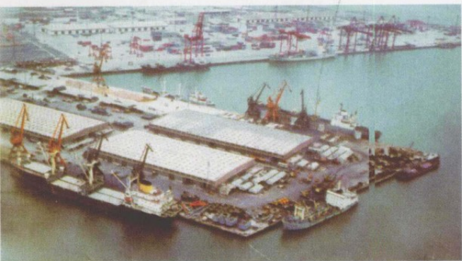
天津新港