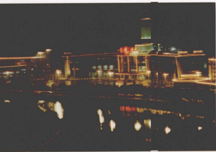
天津老龙头火车站夜景