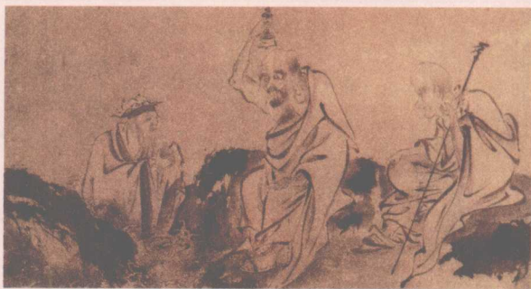
○ 罗汉图(部分) 佚名

于是这些外道豁然开朗,心悦诚服,立刻向佛祖请求皈依佛门受戒,当下证得小乘初果,回到座位中去。到此,佛祖便开始说道:“刚才一幕都看到了吧。你们都好好听着,我现在给你们上一堂故事课,讲讲一些人的一些事情,通过讲解这些事情,你们会有所领悟。”接下来便引出了书中的那些比喻故事。