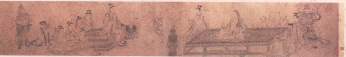
○ 维摩演教图 北宋·李公麟