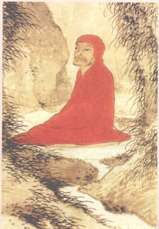
○ 达摩面壁图（部分） 明·宋旭