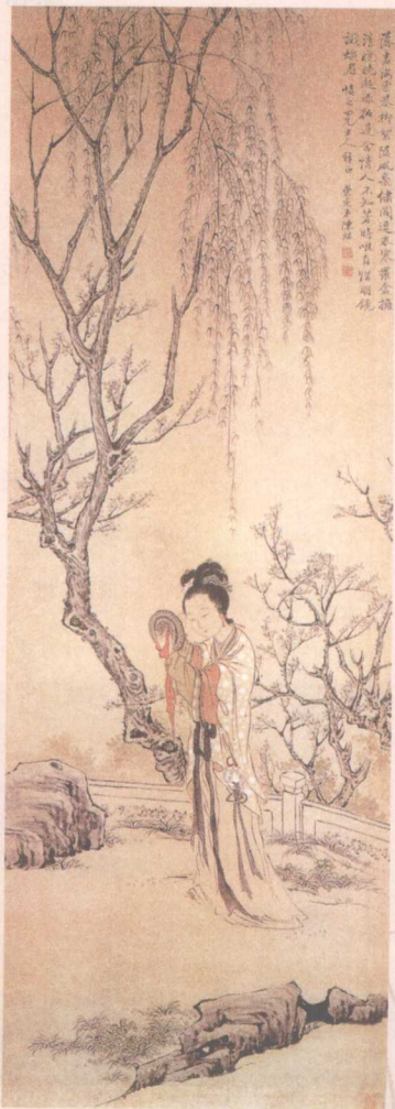
○ 柳下晓妆图 清·陈崇光

佛祖借这个譬喻来笑那些邪门外道的人不辨真伪，固执于假象或迷途，所以，即使得到了正知正解，也不能信受奉行。窃以为，道理是真，但比喻有失妥当，佛法岂能如同荡妇？若只言小潘之真，则难免有断章取义之嫌了。