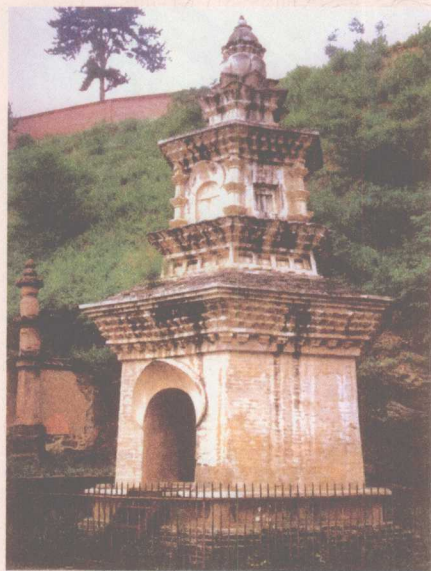
佛光寺祖师塔 南北朝晚期

话说以前有这样一位光头的先生，至于其光头是因为聪明绝顶，还是Y染色体上存在秃头基因，或者自己剃度，还是学时髦理的发型，权且不论。总之他这头一光，马上冒尖，起到了吸引眼球的效果，回头率