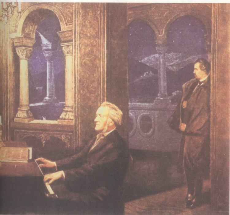
瓦格纳在天鹅堡 为路德维希二世演奏