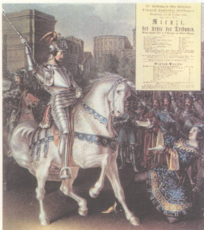
《黎恩济》在德累斯頓的首演(1842年)

不到工资的指挥职位，明娜虽然与瓦格纳举行了婚礼，但对二人的经济前景忧心忡忡，一度还曾离开过瓦格纳。1837年，里加的一家歌剧院邀请瓦格纳出任音乐总监，他在那里开始构思歌剧《黎恩济》。由于身负重债，瓦格纳不得不在夜幕下逃离