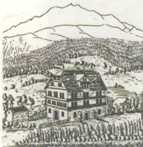
琉森湖畔 的特里布申

11月16日，科西玛断然带着她与瓦格纳的女儿伊索尔德与伊娃住进特里布申，第二年1月1日，科西玛写下第一篇日记，并一直持续到瓦格纳去世为止。在安定的生活环境中，瓦格纳重新开始了《尼伯龙根的指环》的写作，此时距上次搁笔已经相隔12年。同年5月，瓦格纳在莱比锡认识的年轻哲学家