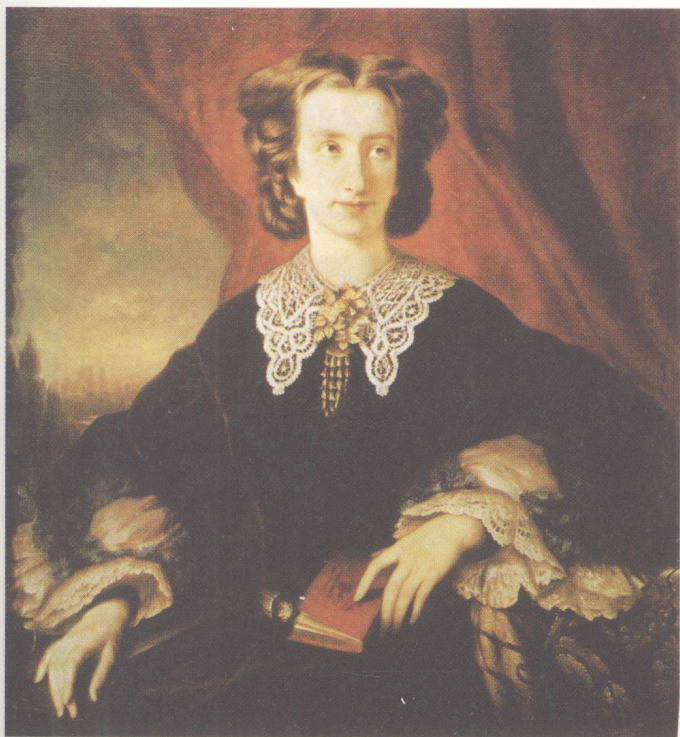
李斯特的女儿、 瓦格纳的第二个妻子 科西玛

1869年9月22日，路德维希二世在违反瓦格纳意愿的前提下，坚持在慕尼黑首演了《莱茵的黄金》，第二年，他同样不顾瓦格纳的抗议，又首演了《女武神》。瓦格纳深信他的《尼伯龙根的指环》在传统剧院不可能获得最佳演出效果，于是，他与路德维希二世的冲突已经不可避免。他开始认真地为上演《尼伯龙根的指环》找一个合适的演出地点。他想到了一个他曾经路过的小城拜罗伊特，那里的采邑伯爵剧院有一个超大型的舞台。可是当他1871年4月前往实地考察时，发现它并不适合演《指环》。瓦格纳当场就决定在拜罗伊特重新建一座新剧院。他知道这样大的工程需要不菲的资金，以后的五年他都不辞劳苦地为这项计划寻求财政支援。在年轻钢琴家陶西格的建议下，发行“赞助卡”来募集资金。后来赫克尔又筹备成立了“瓦格纳协会”，让财力不足的赞助人以合资形式购买赞助卡。