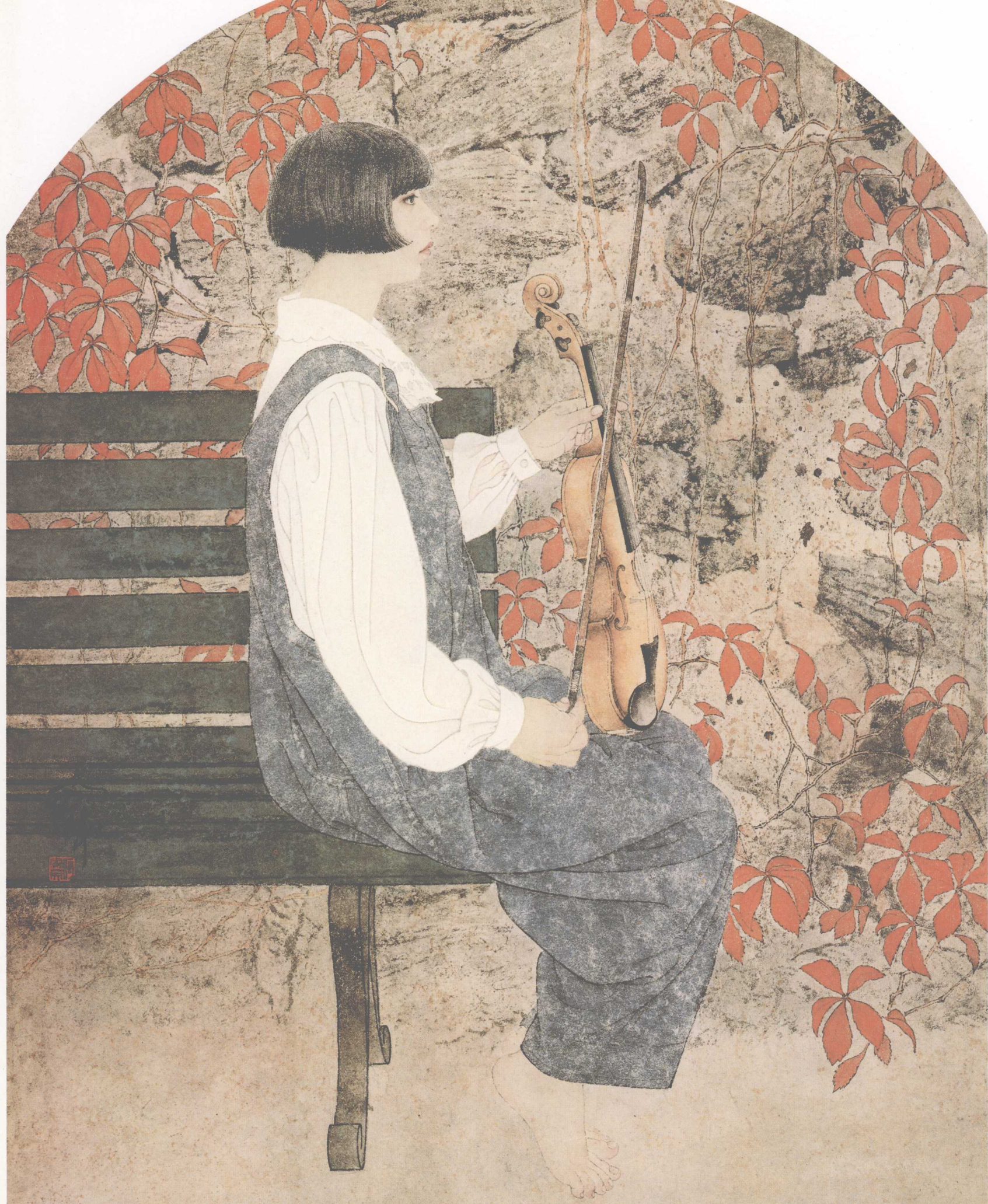
秋韵 190cm × 140cm