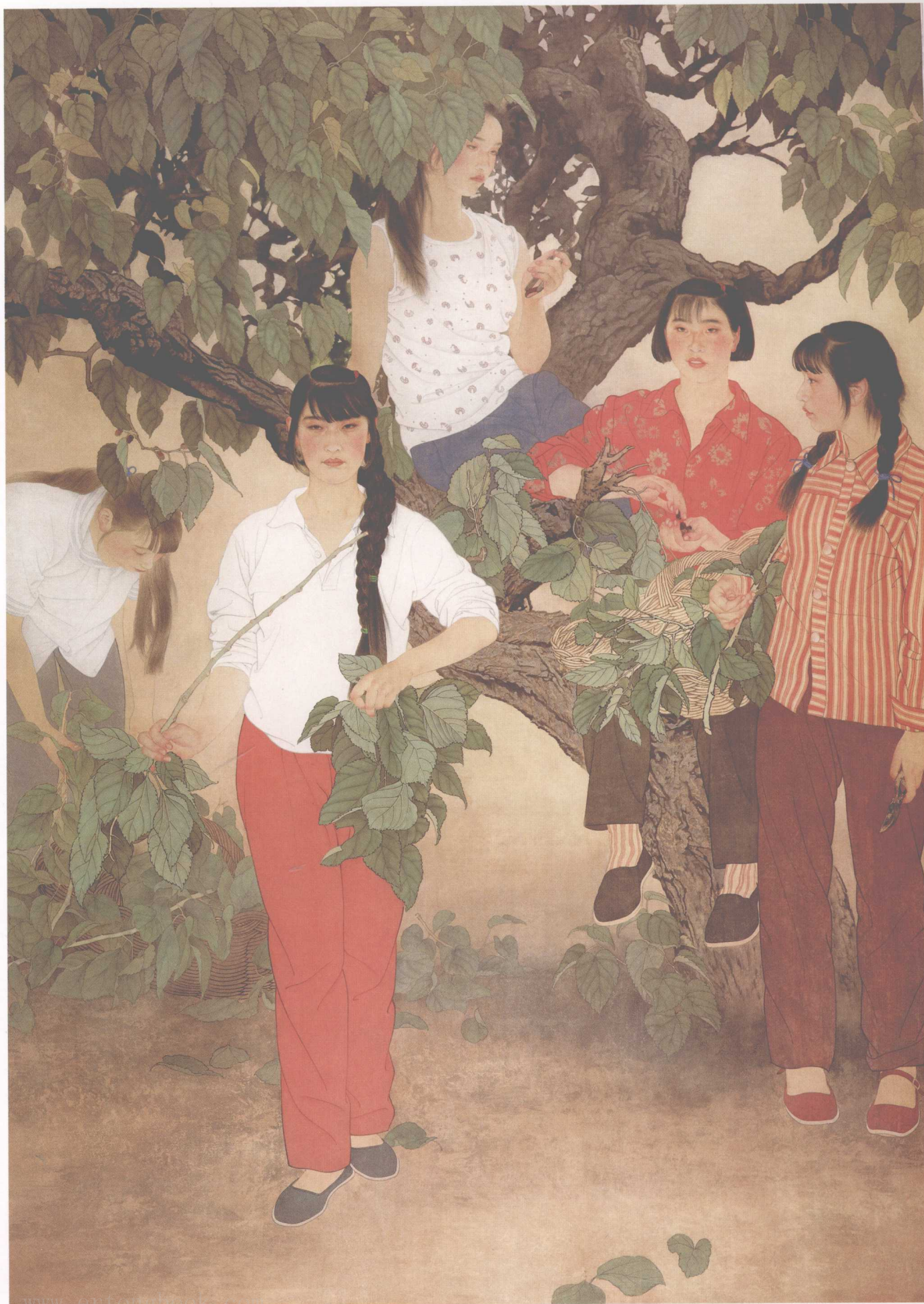
桑露 210cm × 150cm

将这些想法写出来，目的在于给读者树一个箭垛，接受不同方向的批评，用以指导我将来的创作实践。下一步，我将要做的工作是将“衡中西以相融”继续深化，或可叫“权工写以相合”。我一直有一个愿望，工笔人物画不仅要大方，而且要大气，要味厚、力厚，浑然有势，我甚至想把古代壁画的一些效果引入，即尽可能地使工笔人物画的气象宏大起来。当然，这仅仅是些想法，接下来的问题是如何按照上述想法画出画来，把思路化为笔痕。