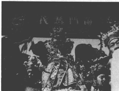
图3 2005年“皇会”上天后“出巡”的场面

从2005年起，天津又恢复了“皇会”。每年农历三月二十三日前后，在古文化街天后宫举行天后诞辰民俗旅游周。届时宫内举行隆重的天后祭奠仪式，表演龙灯、舞狮、高跷、旱船、法鼓等传统民间花会，香客云集，游人如织。