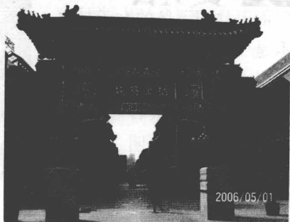
图2 古文化街北口楼匾

随着时代的变迁，东庙已于1950年移作他用，西庙于1985年进行了大修，辟为民俗博物馆，成为展示天津历史发展、民间风俗的重要场所。天后宫附近是天津早期商业和民俗活动繁华之处，现辟建为富有天津味、古典味、文化味的“古文化街”，古朴典雅，常年都十分热闹。古文化街的南、北口，各竖一座大牌楼。南口的楼匾写有“津门故里”四字，寓示着这里是天津的发祥地。北口的楼匾写有“沽上艺苑”四字，表明这里的街貌、店铺、商品都带有天津古代文化气息。