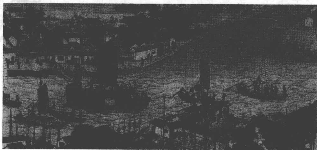
图5 [清] 江萱《潞陈光远旧居河督运图》局部

清朝乾隆年间，画家江萱描绘了一幅高48厘米、长690厘米的风俗长卷《潞河督运图》，以写实的手法展现了乾隆末年座粮厅使冯应榴乘船经潞河前往天津三岔河口一带视察漕运的情景。画面上有各种人物798人，各式船舶64艘，姿态万千，栩栩如生。在桃花盛开的郊野乡村，妇女怀抱婴儿，孩提嬉戏玩耍；农夫或荷锄、或担筐、或灌田、或叱犊。在繁华的城关街市，有行商坐贾、叫卖摊贩、弹唱艺人以及文武官员、随从兵卒、差役人夫，熙熙攘攘，反映了当时三岔河口至天后宫门前繁忙的航运景象和市井生活，堪称是清代天津的《清明上河图》。2004年，天津市在金钢桥上游三岔口海河源头左岸修建起了一堵大型浮雕墙，全长99米，浮雕基座高0.6米，画面净高为2.6米，其中一半画面即为《潞河督运图》，另一半为《三岔河口记》，成为天津市的一个文化景观。