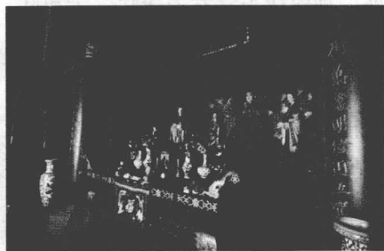
图1 天后宫大殿内天后圣母像

天后即妈祖，相传是福建莆田县湄洲岛的女子林默，本是一个普通渔家女子，因救助海难而献身，年仅27岁。林默死后被百姓奉为海神，经宋、元、明、清历代帝王敕封褒扬，地位由夫人到天妃，由天妃到天后，不