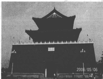
图 4 今日鼓楼

天津设卫筑城之后，人口剧增。一方面，从外地调来戍守三卫的军人及其家属数量不少，另一方面，由于商业的繁荣，外乡商贾纷纷携家带口移居天津，成为天津的常住居民；加之同样由于繁荣而吸引了众多的外地务工人员及各色艺人