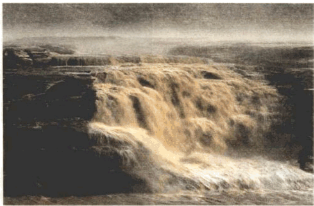
壶口瀑布如万马奔腾,气势雄伟