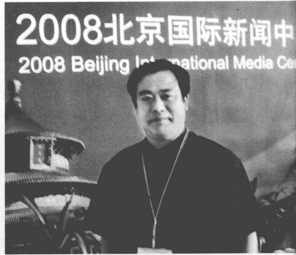
北京奥运会期间，在北京国际新闻中心为世界各国记者表演书法