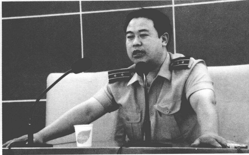
在中国人文大学讲课