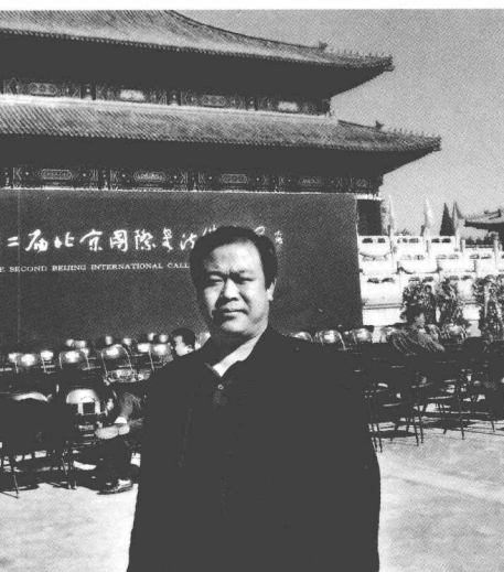
参加第二届北京国际书法双年展