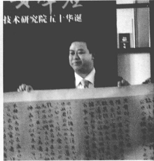
向航天部领导赠送作品