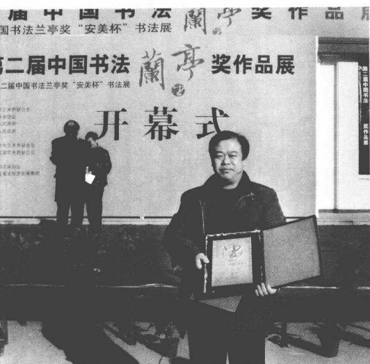
在第二届中国书法兰亭奖开幕式上