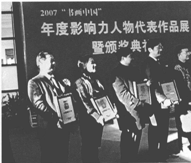
被传媒委员会评为“2007 年度影响力人物”，图为颁奖典礼