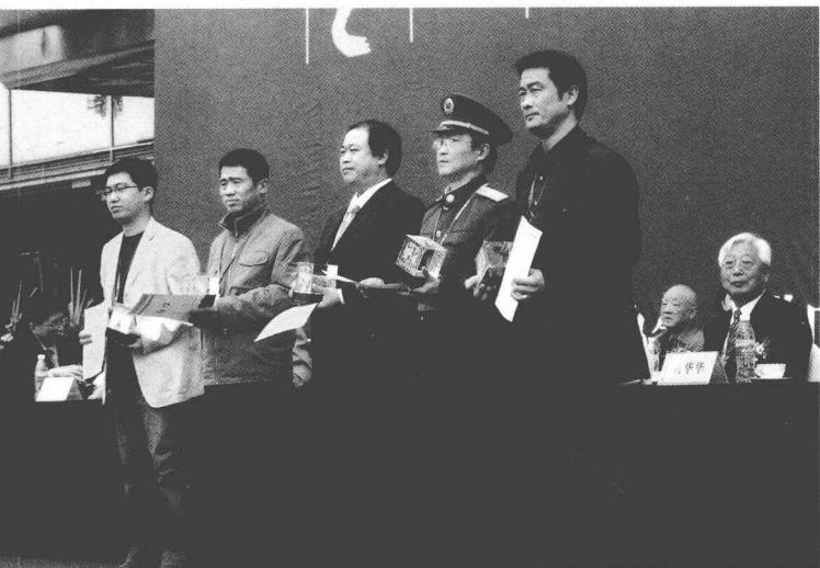
在第九届全国书法篆刻展览领奖台上