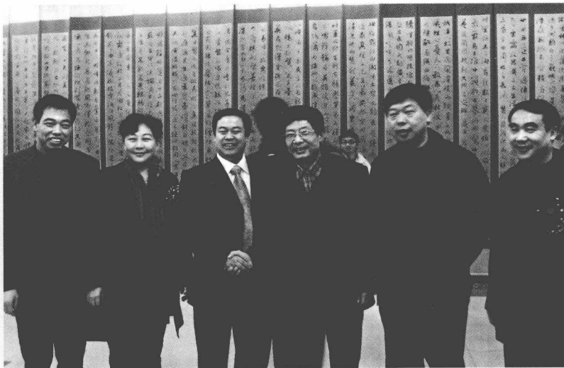
在故乡举办个人书法展，与市县领导合影