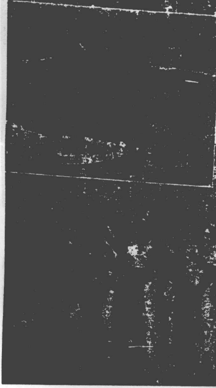
← 少女奧林 匹克舞