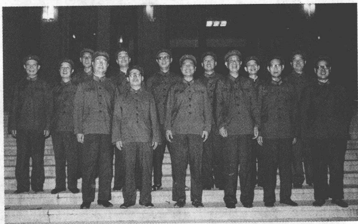
1977年7月21日，庆祝中国共产党十届三中全会胜利召开，空军领导合影。左起：周彪、何廷一、薛少卿、成钧、刘世昌、高厚良、黄立清、张廷发、张积慧、曹里怀、邝任农、吴富善、王定烈、旷伏兆在一起。