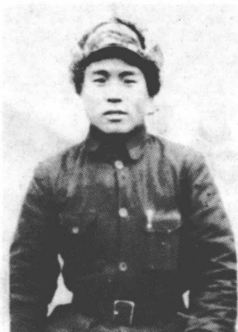
1943年9月,于山东汶上 县官庄。