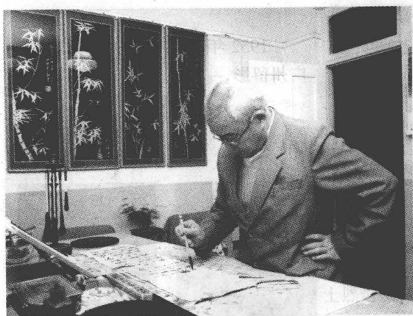
研习书法,自得其乐。