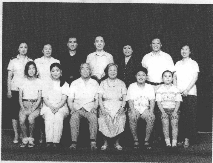
1996年7月27日与夫人、子女们在一起。