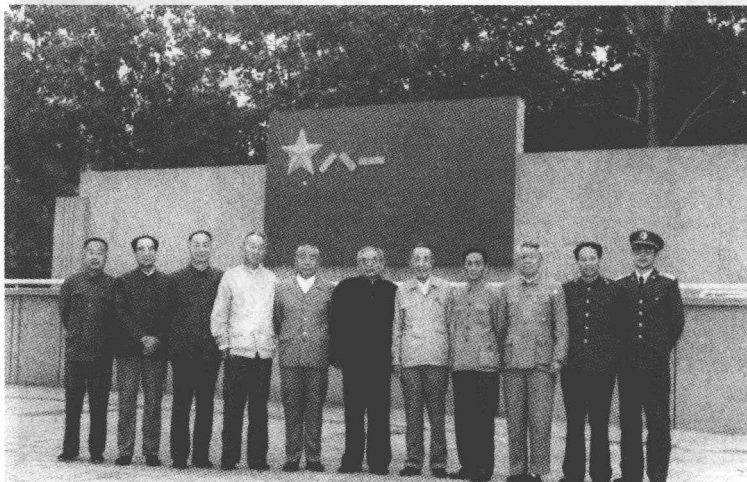
1989年10月,湖北军区《中原突围》编辑组与当年参加中原突围的在京部分老同志合影。