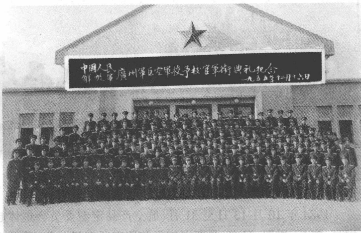
1955年12月16日在广空合影，前排左十三为刘亚楼，右九为王定烈。