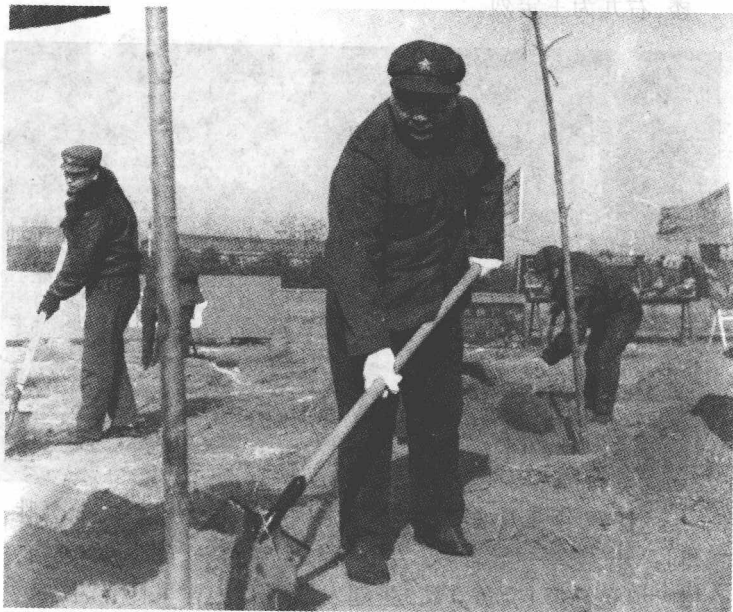
1985年3月12日,在北京西郊机场与飞行员们一同植树。