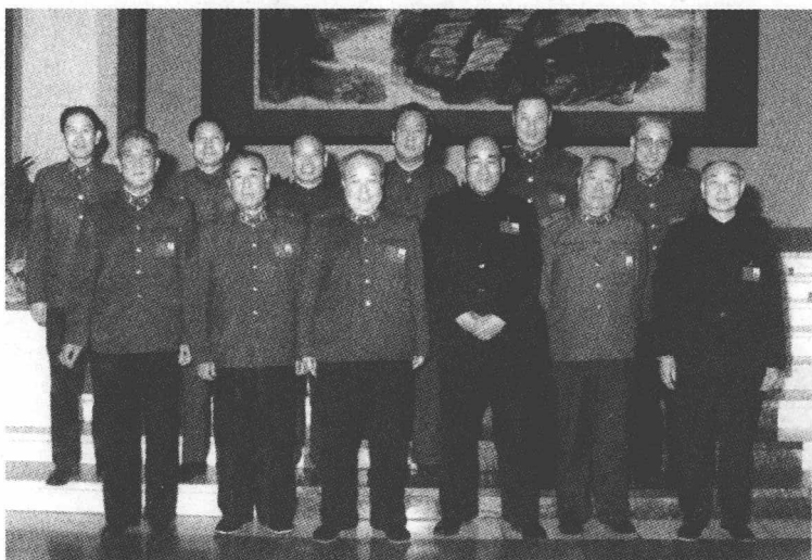
1987年4月,在全国人大第六届五次会议上,空军铁道兵组代表合影。