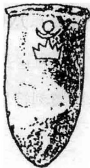
图 1.1.2 有象形符号 的灰陶缸

那么原始汉字是何时产生的呢？这要考察考古提供的资料。山东莒(jǔ)县的陵阳河遗址属于大汶口文化晚期，在这里出土的灰陶缸上发现四个象形符号。在同一时期诸城前寨也发现一个残缺的象形符号。灰陶缸和五个象形符号形体(见图 1.1.2 和图 1.1.3)如下：