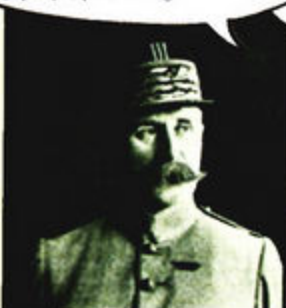
Henri Philippe Pétain 1856~1951