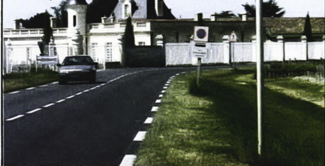
•波尔多玛歌 (Margaux) 的路标。