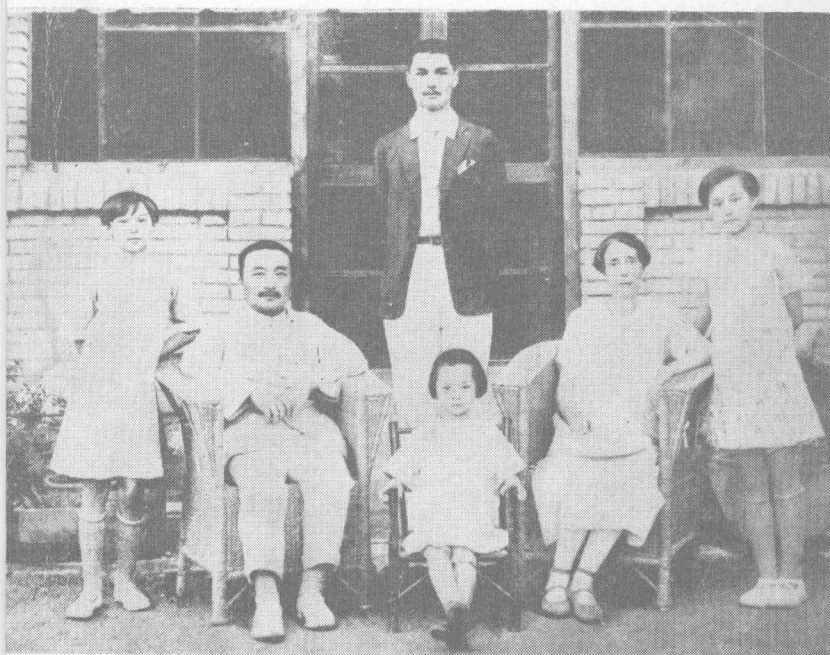
一九二八年作者全家 在北京合影。(前左第 一人为作者)