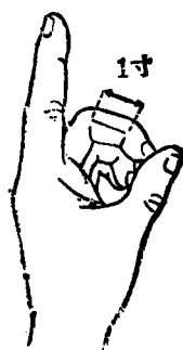
图 1-2 中指同身寸法