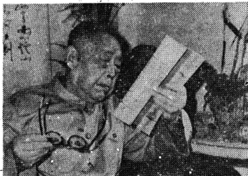
· 郭绍虞 ·