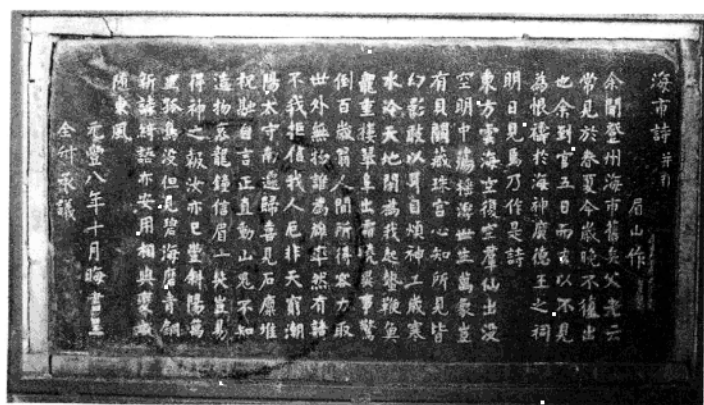
《海市诗》刻石