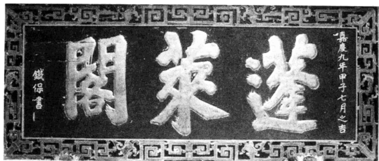
“蓬萊閣”字匾