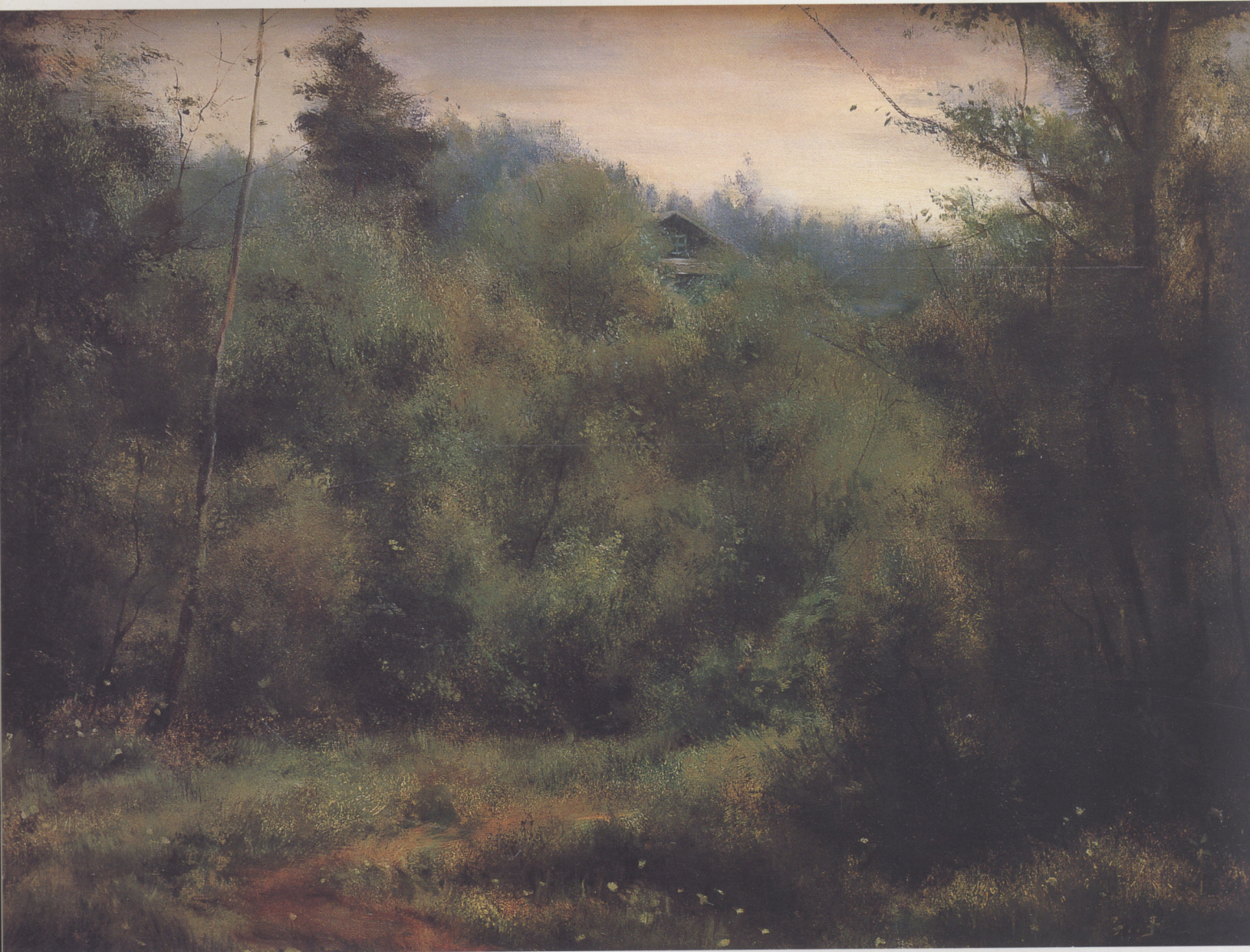
丛林深处 1993年 布面油彩 60 × 80cm