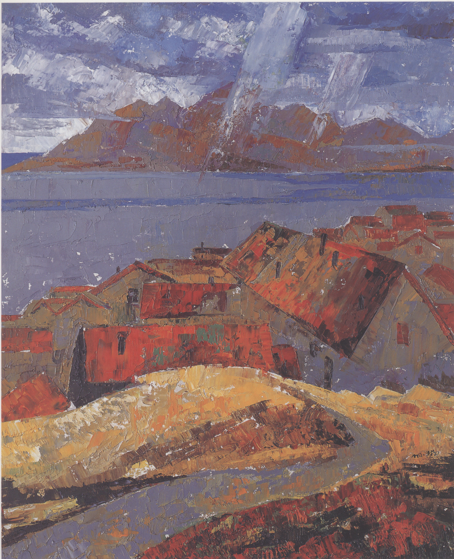
石岛渔村 1998年 布面油彩 120 × 100cm