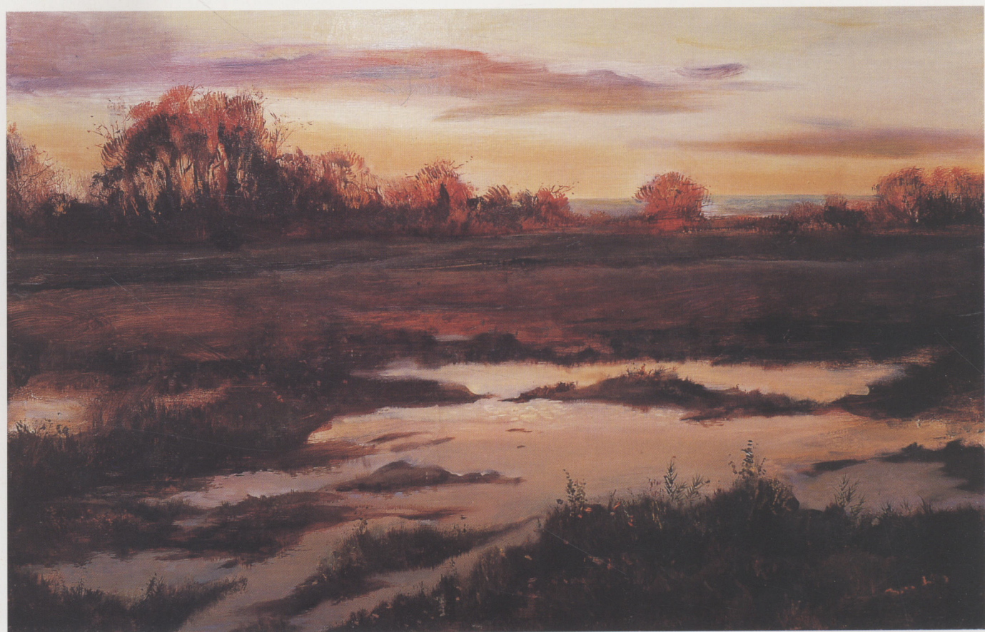
红霞 1994年 布面油彩 80 × 100cm