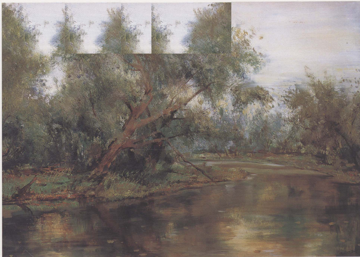
波 1998年 布面油彩 50 × 70cm