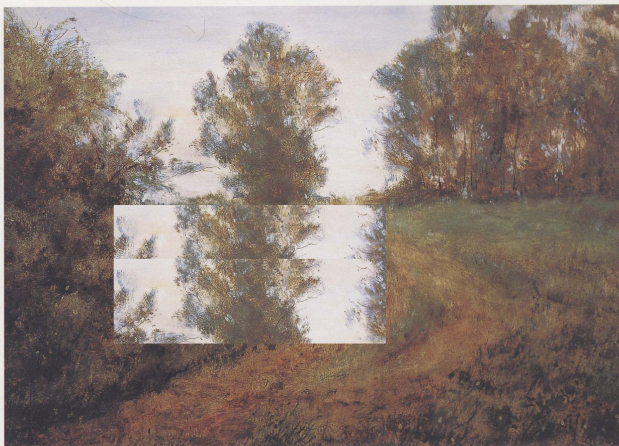
坡 1998年 布面油彩 60 × 80cm