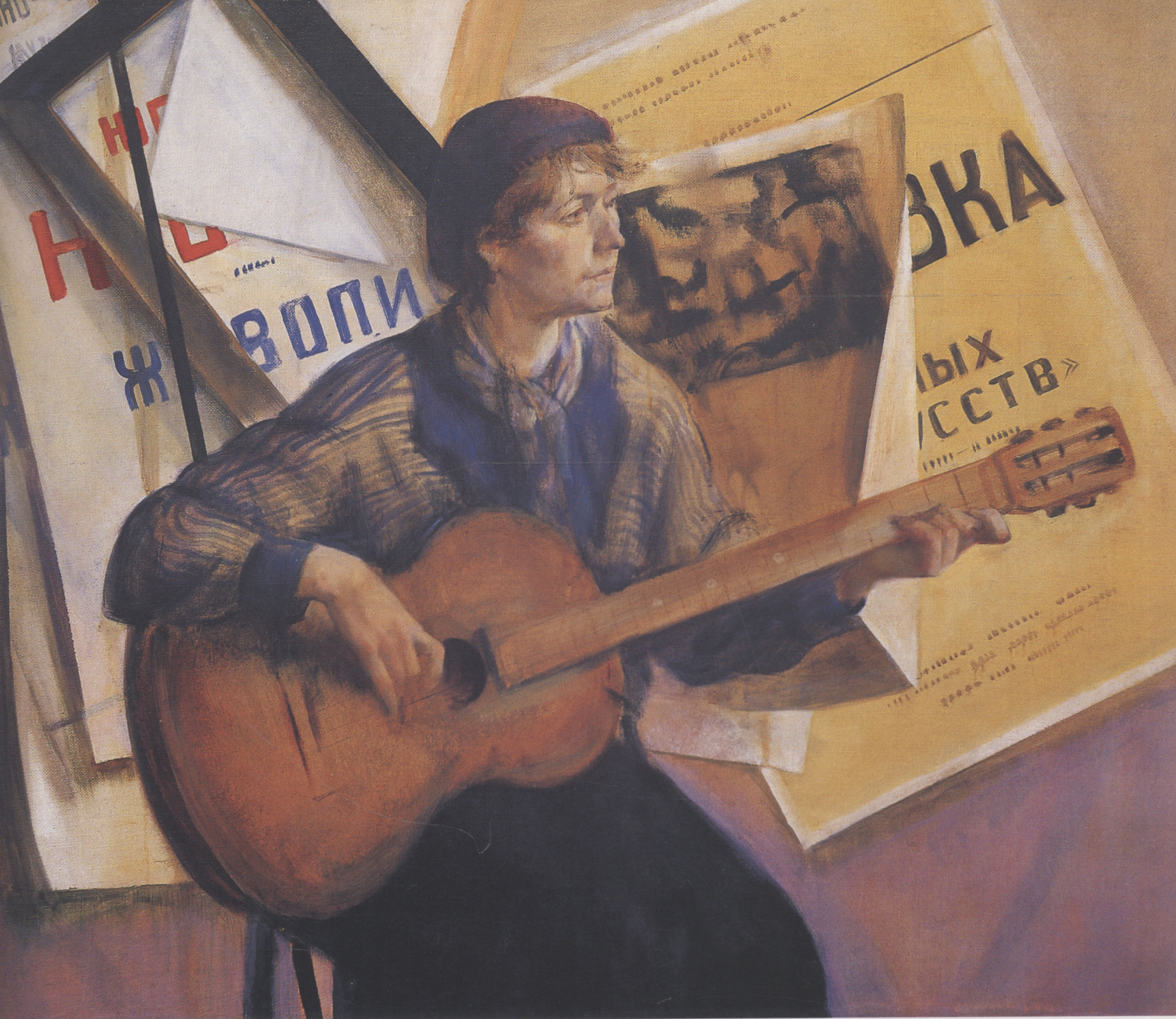
弹吉他的青年 1995年 布面油彩 100 × 120cm