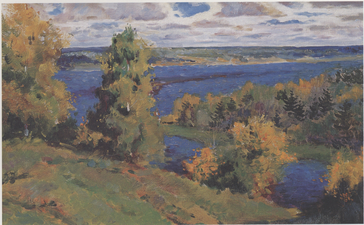
蓝色的伏尔加河 1996年 布面油彩 40 × 60cm