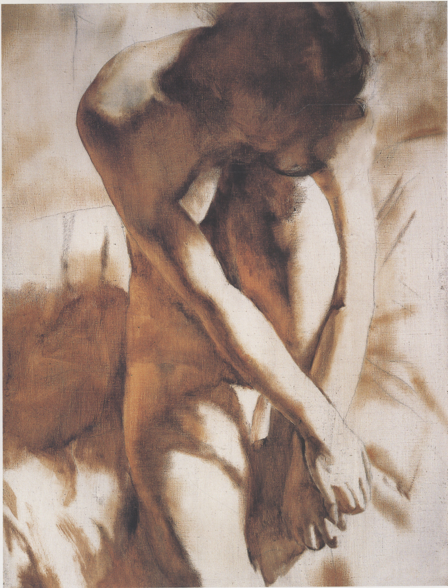
晨光之一 1998年 布面油彩 80 × 60cm