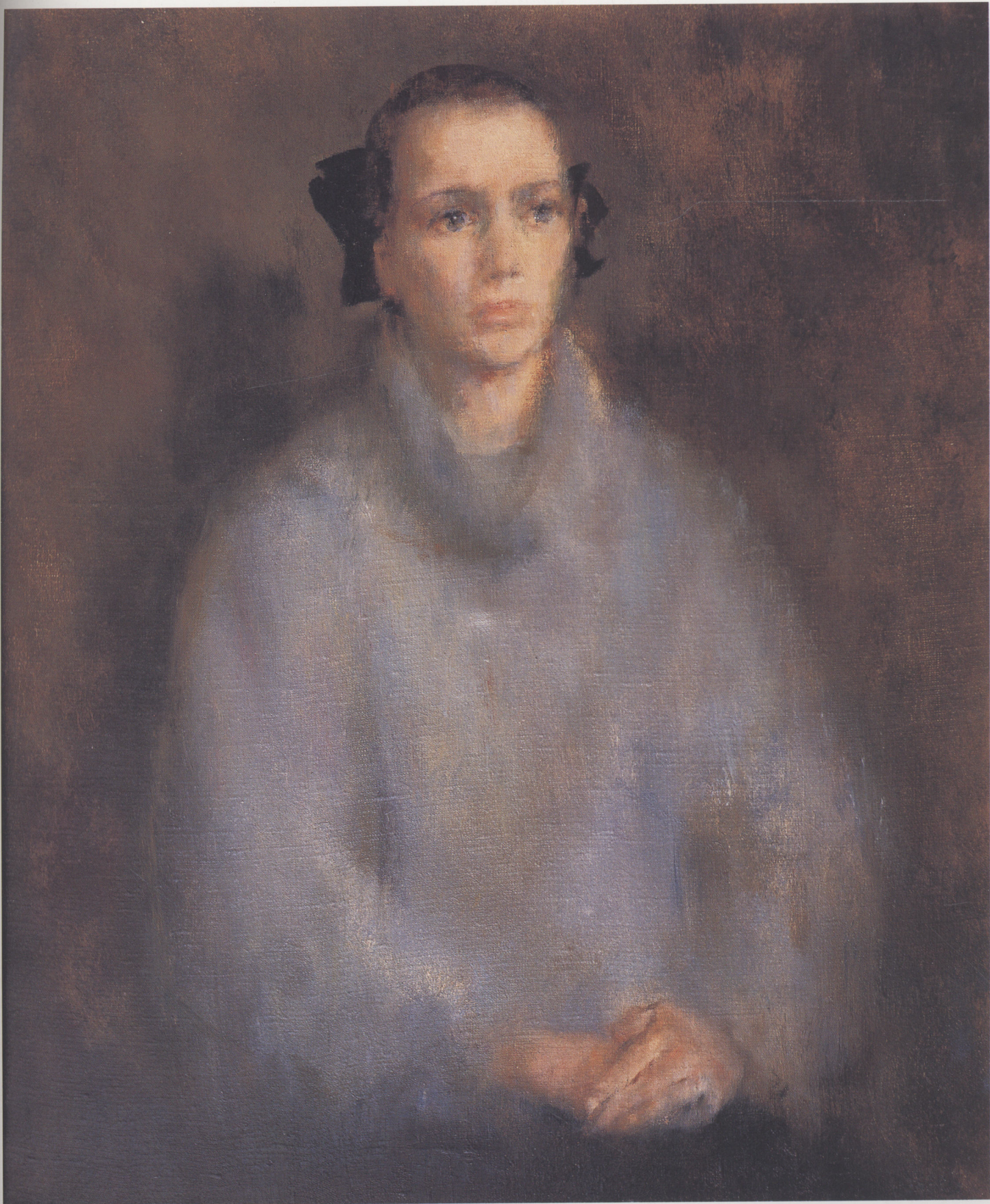
俄罗斯姑娘 1994年 布面油彩 80 × 60cm