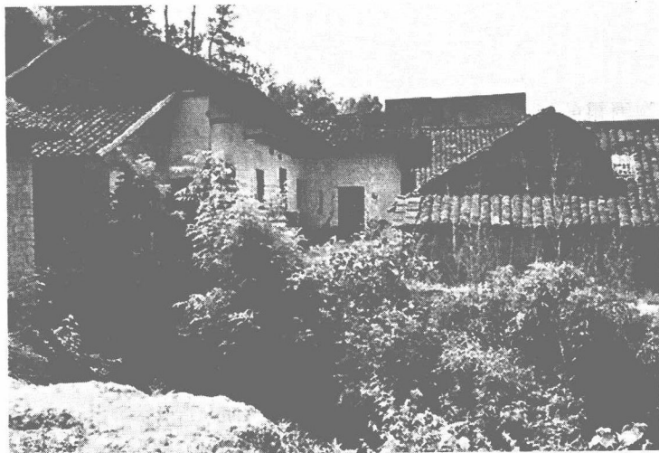
陈赓故居部分房屋。