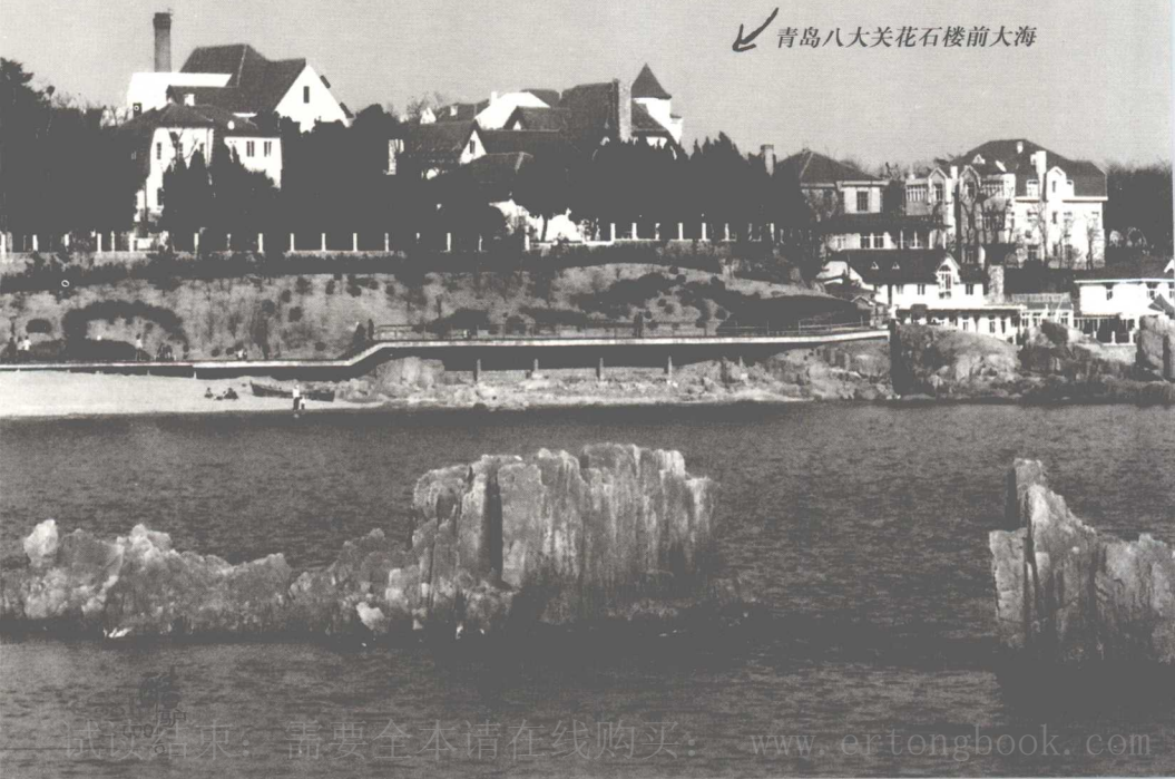
青岛八大关花石楼前大海

在山东旅行，一年四季均可。山东的路况，无论刮风下雨都不会影响出行。但由于环境的恶化，3月左右山东的部分地区也会有沙尘暴。另外尽量避免“五一”、“十一”到泰山、曲阜等名胜地点，不然只可观人了。青岛、烟台等地确是夏天避暑、游泳的好地方。冬天春节期间可以到沂蒙山区体验山里人过大年的喜庆气氛。