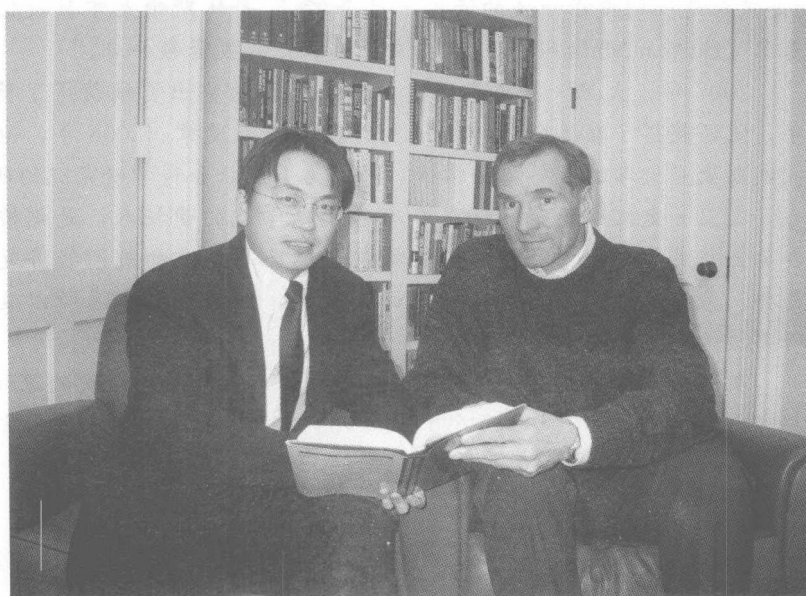
右为本书作者大卫·史文森，左为本书主译之一张磊

大卫·史文森是耶鲁的首席投资官，他管理着耶鲁大学高达 230 亿美元的捐赠资产。在他领导的 20 多年里，耶鲁捐赠基金创造了近 17% 的年均回报率，这在同行中无人能及。大卫·史文森早年在耶鲁获得了经济学博士学位，目前带领 20 人的投资管理团队在耶鲁大学位于纽黑文的校园内工作。