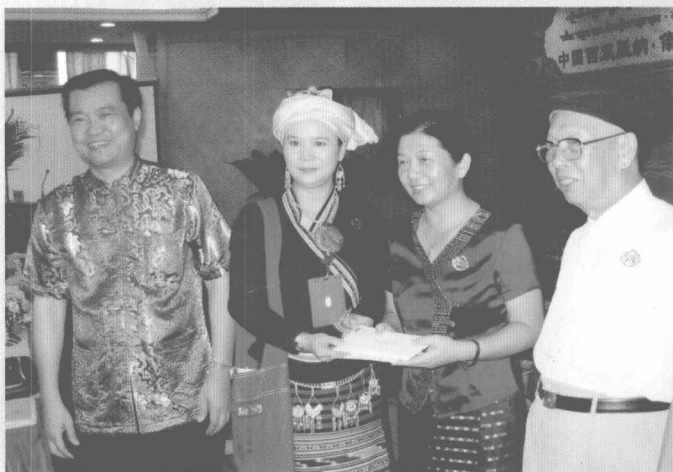
西双版纳傣族自治州州长刀林荫与泰国专家互赠礼品