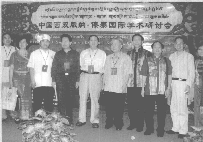
学会领导和部分与会专家合影