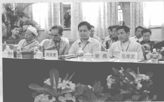
专家在会上进行学术交流