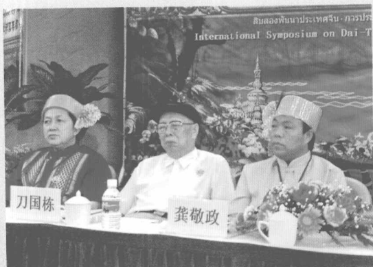
领导在会上听取专家发言