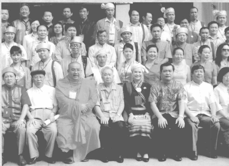
部分参会专家合影