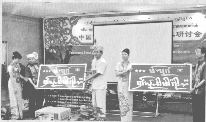
德宏州瑞丽市傣学研究会向大会赠送匾牌