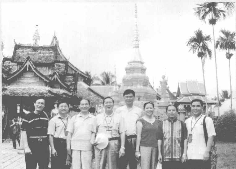
学会领导和部分专家合影