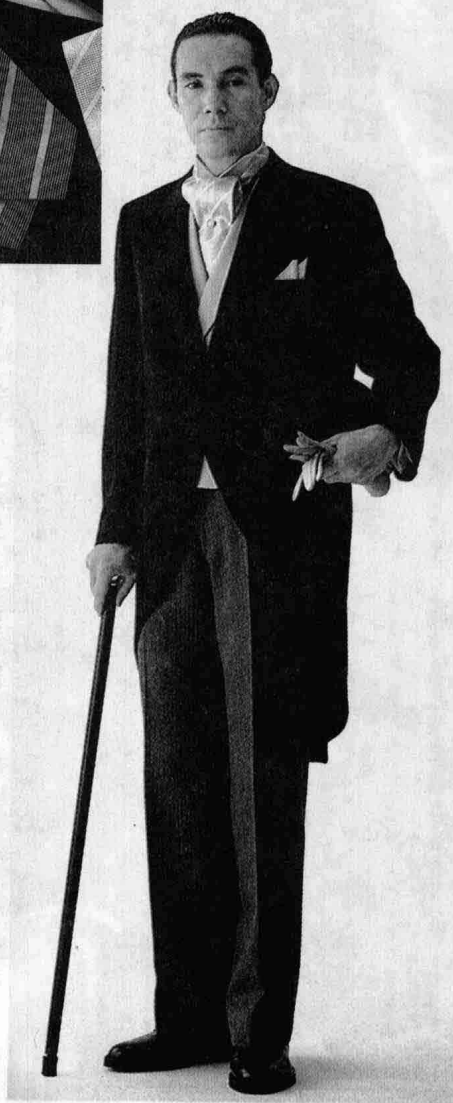
彩图 3-a 晨礼服