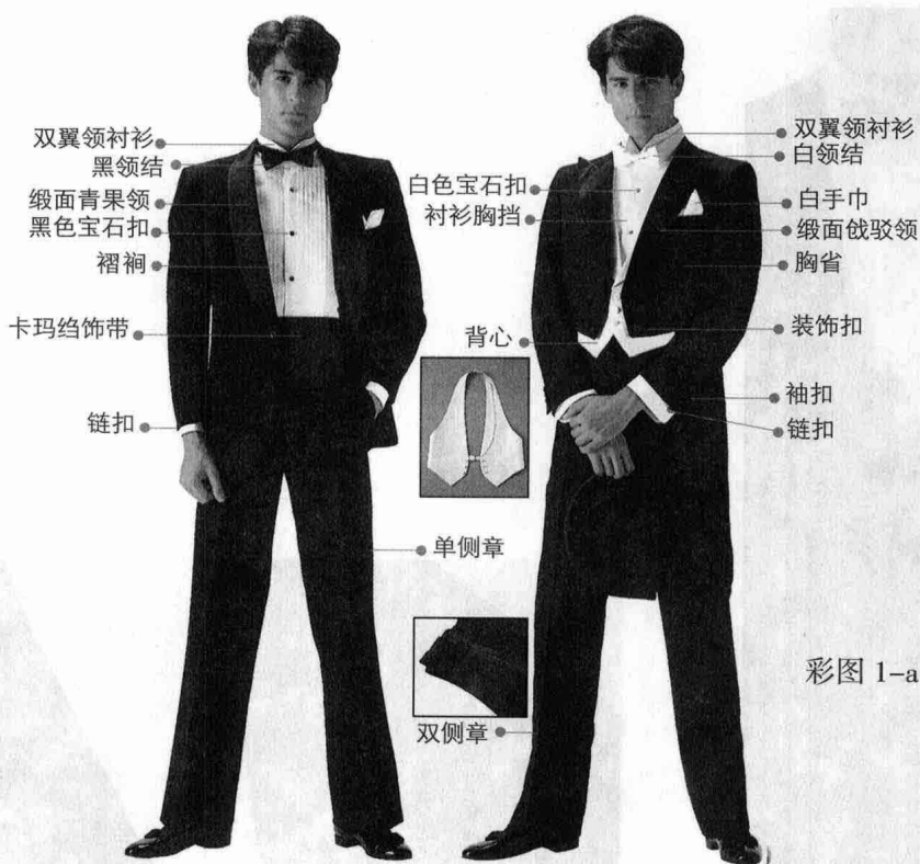
彩图 1-a 燕尾服和塔士多礼服 (正面)