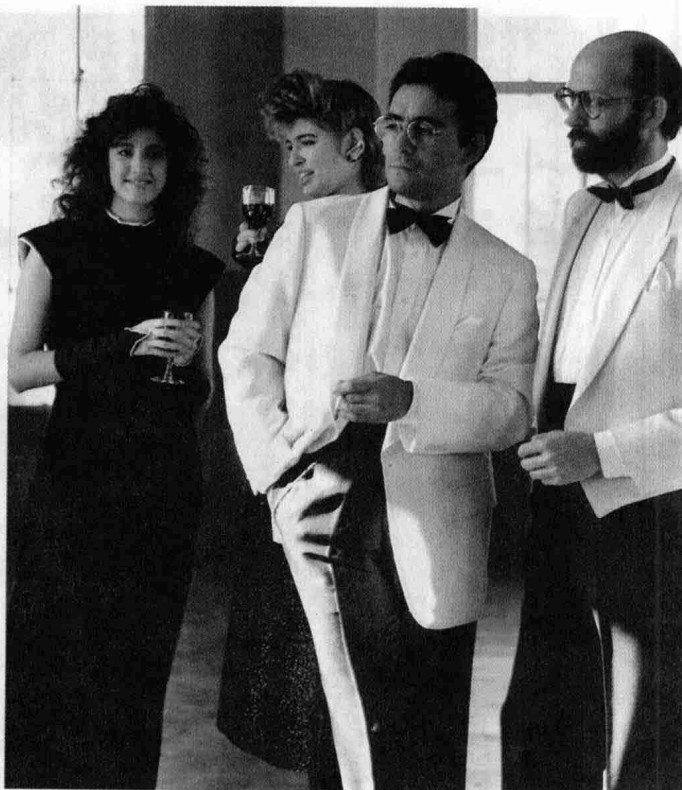
彩图 2 夏季塔士多礼服和梅斯