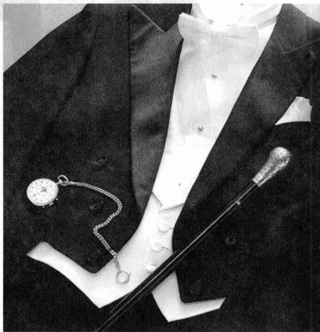
彩图 1-c 燕尾服局部