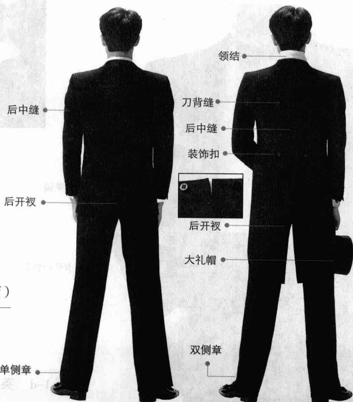
彩图 1-b 燕尾服和塔士多礼服 (背面)