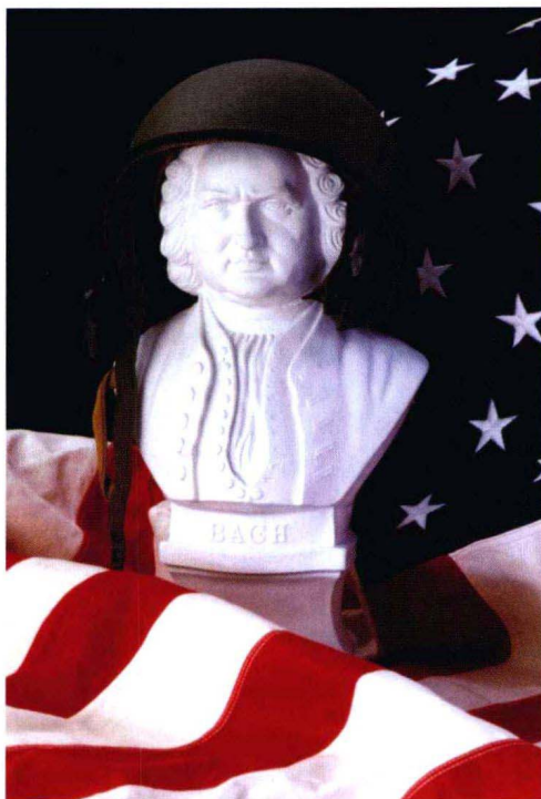
图 1-2 这是一幅数码照片。蓝色效果比胶片相机拍摄的效果要好，但绿色和红色较差。这不一定是由使用胶片相机或者数码相机造成的差异。使用别的数码相机或者胶片相机，结果可能会完全不同

从一定程度上来说，数码相机也可以被看作是电脑，因为相机生产者可以为相机编程，无需摄影师知情或同意即可改变图像。这通常是一件好事，因为相机的决策通常是正确的。更大的问题是对于学生而言，了解究竟是相机的决策还是摄影师的决策并不容易。你可以犯相机能够修复的错误，并从中得到教训，相机可能犯错误，而你却毫不知情地责怪自己。