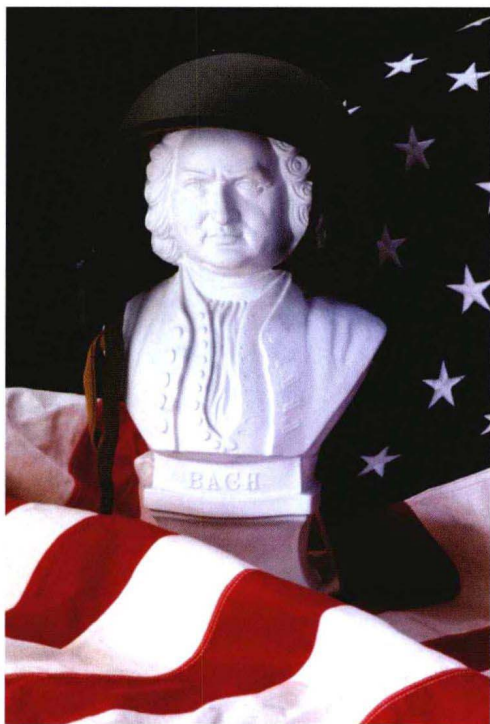
图 1-1 这幅图片是用胶片相机拍摄的，借助更好的明锐度可复制更大尺寸的照片，但在这种复制尺寸情况下，这一优势毫无用处

品质越好的数码相机越接近胶片相机，除了分辨率不能够放大到极限，或者像传统相机上的“扫描式”后背一样，分辨率接近胶片，但必要的曝光时间使其不能拍摄移动的物体。两者都没有影响用光，但让人有理由来质疑相机。