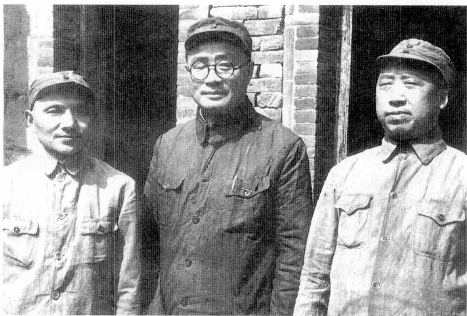
1945年，129师刘伯承师长邓小平政委与八路军副参谋长滕代远在涉县赤岸