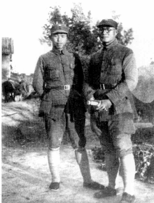
抗战期间，刘伯承师长与129师政治部副主任黄镇的合影。