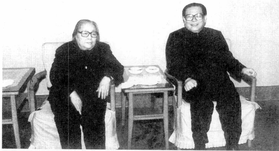
1992年12月3日，在纪念刘伯承诞辰100周年时，江泽民主席会见汪荣华的合影。