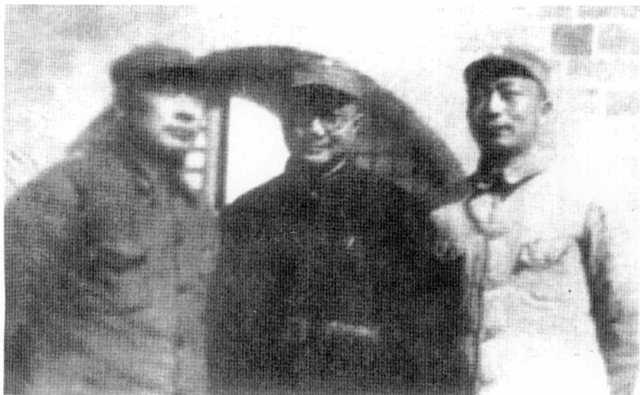
1943年，刘伯承、陈毅、聂荣臻在延安合影。