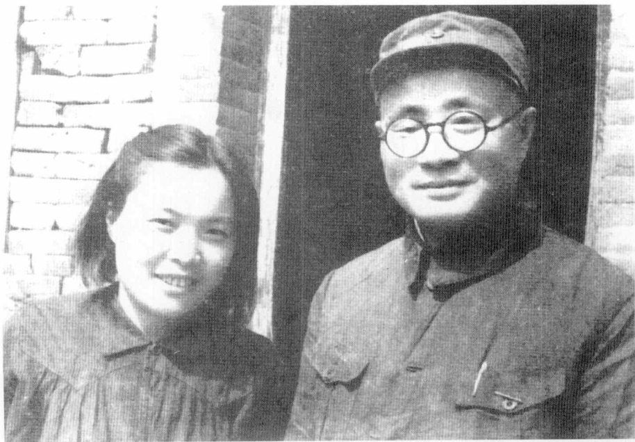
1947年，刘伯承与 夫人汪荣华合影。