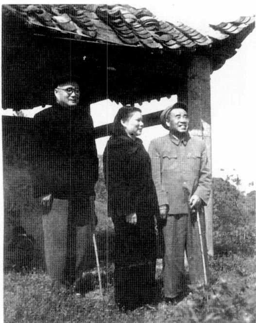
1954年，刘伯承与 朱德、康克清在南京。