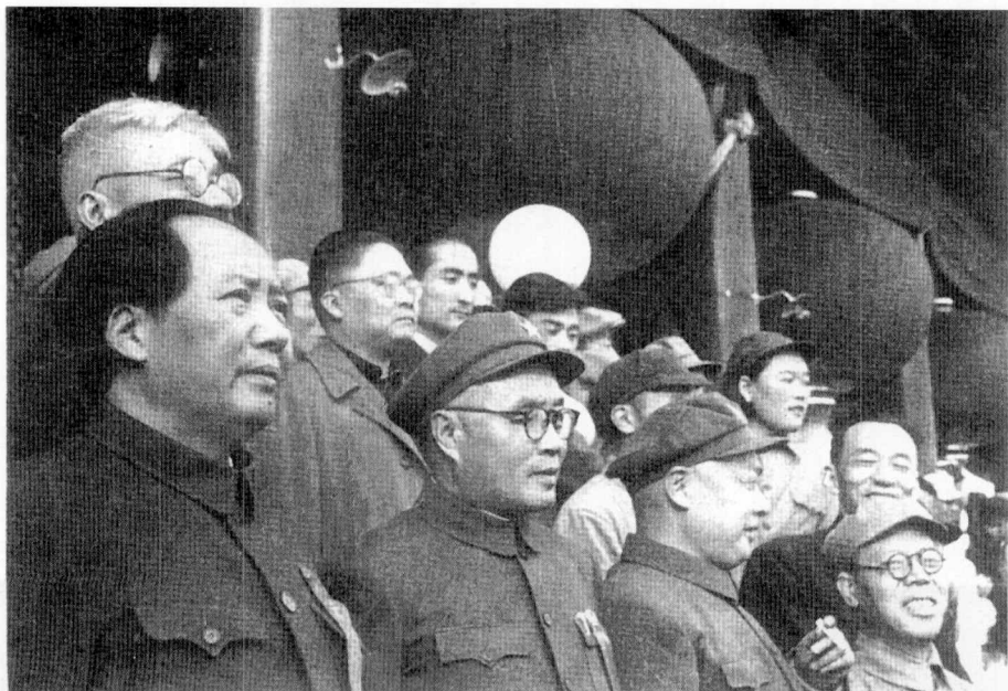
1949年10月1日，参加国庆大典，与毛泽东主席等党和国家领导人检阅游行队伍。