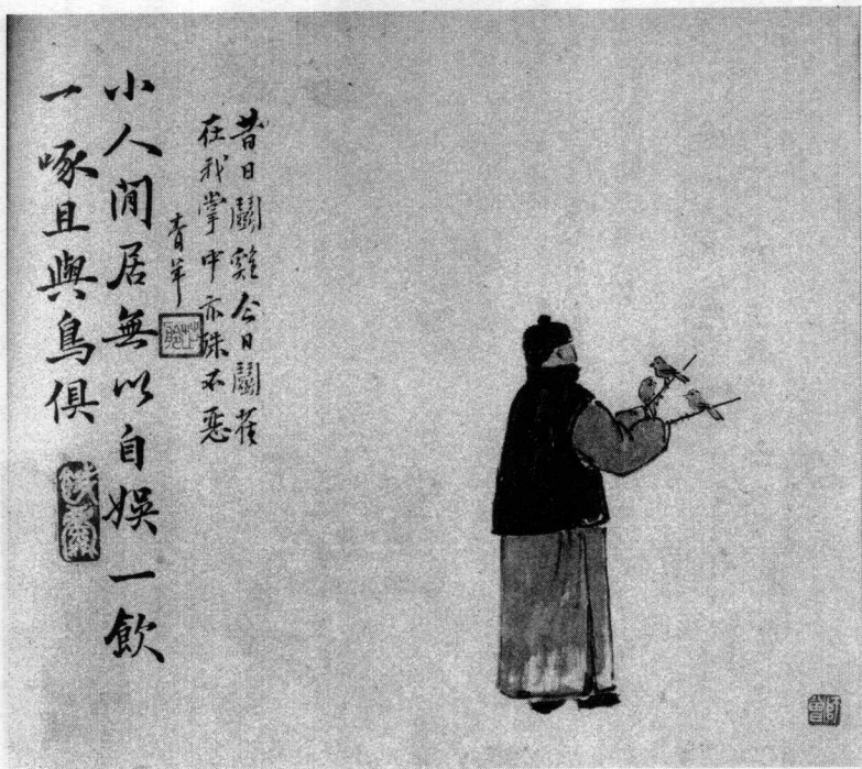
《玩鸟》，陈师曾《北京风俗》第八图，画上题诗： 昔日斗鸡，今日斗雀。在我掌中，亦殊不恶。 羊青 小人闲居，无以自娱。一啄一啄，且与鸟俱。 下钤“饿麟”印