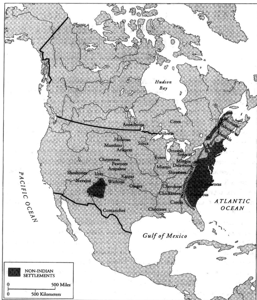
1763 年前后非印第安人居住区和印第安人部落群居住区选图