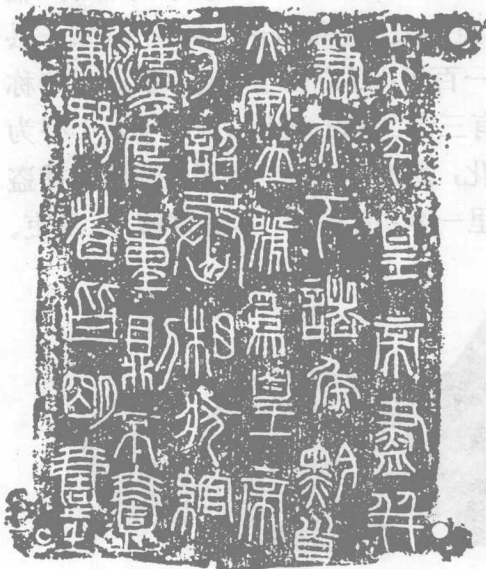
秦始皇二十六年诏版(拓本)

大体都化为同了。周朝文字笔画繁重，称为大篆，或称籀(音宙 zhòu)文。战国时东方齐鲁地方文化发达，通行一种比较省便的字体，汉朝人称为古文、蝌蚪文、或孔壁古文。李斯订定文字，依据