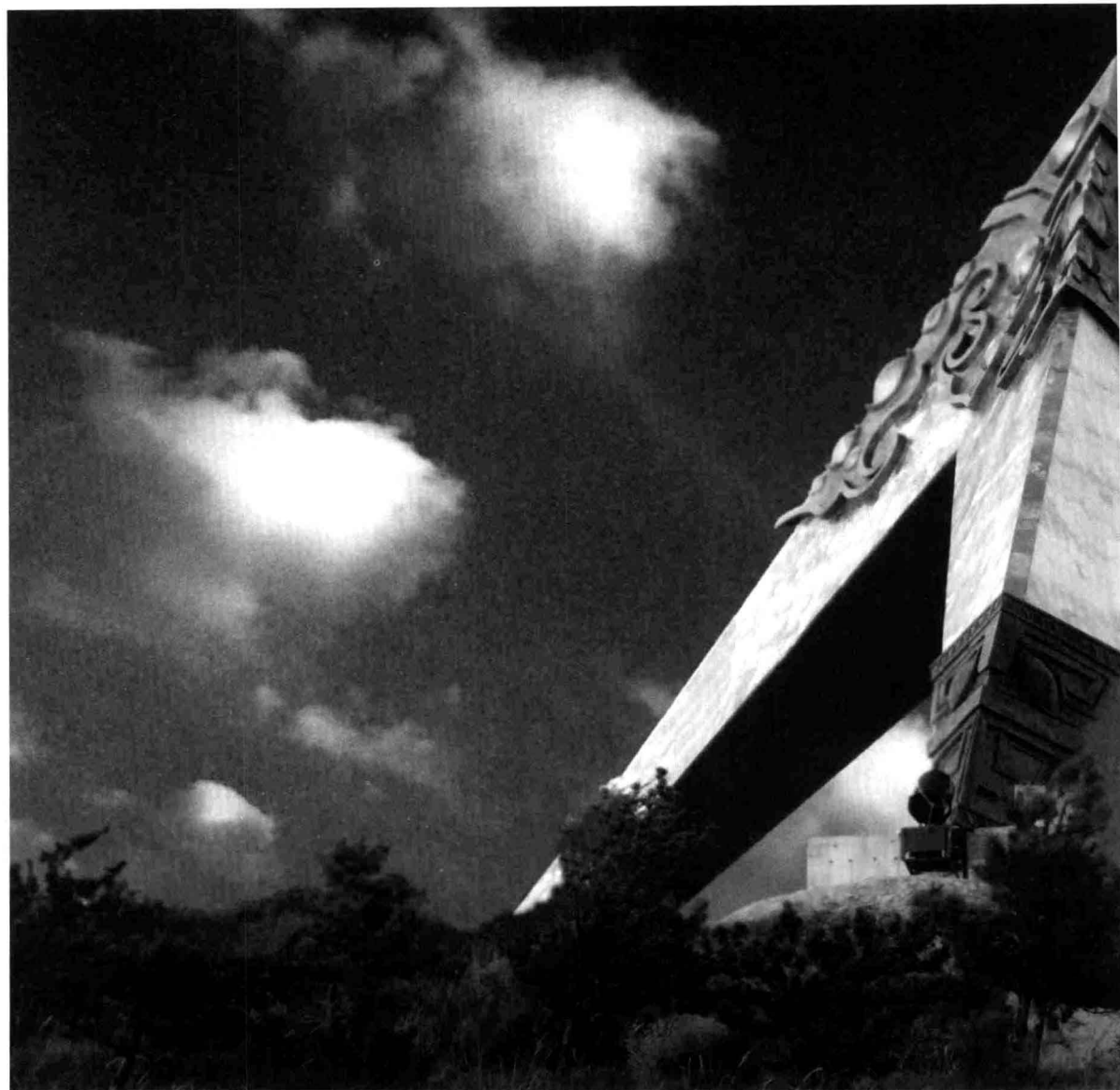
“金三角”经济圈雕塑