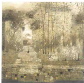
「图犹不见人到此」 1992年