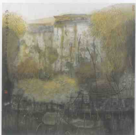
「疏林老屋落照中」 1992年