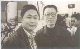
」和列二胡先生在越南