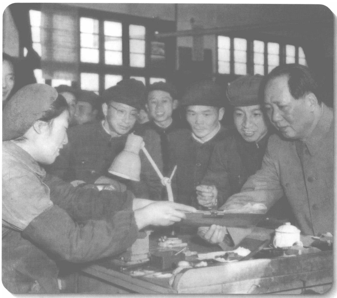
▲ 1956年，毛泽东视察南京无线电厂。