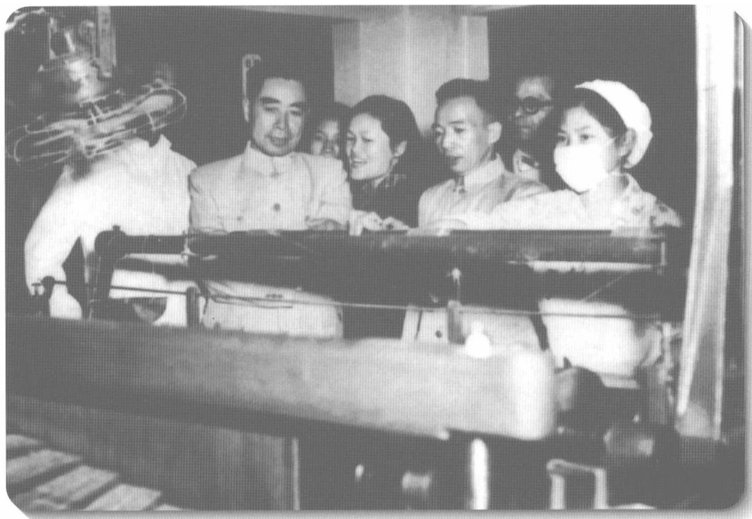
▲ 1955年，周恩来视察北京国棉一厂。