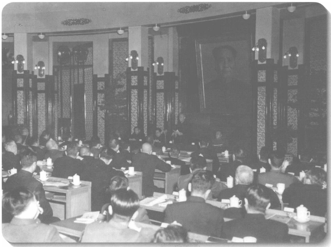
▲ 1954年2月6日至10日召开的中共七届四中全会，批准了中央政治局提出的过渡时期总路线；通过了关于召开中国共产党全国代表会议的决议；揭露和批判了高岗、饶漱石的反党分裂活动，一致通过了《关于增强党的团结的决议》。图为刘少奇代表中共中央作报告。