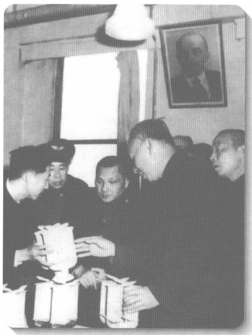
◀ 1955年11月，刘少奇、邓小平、杨尚昆视察沈阳飞机制造厂。