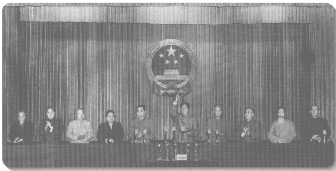
▲ 1954年9月，第一届全国人民代表大会在北京召开。会议通过了《中华人民共和国宪法》，并用法律形式把过渡时期总路线规定为国家的总任务。