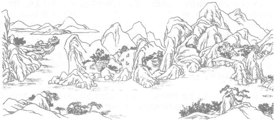
图1-1 辋川别业图局部

唐代官僚士大夫的宅第、府署、别业中筑园很多。如白居易建于洛阳的履道坊宅第为“十亩之宅，五亩之园，有水一池，有竹千竿”，即是清静幽雅的私家园林。与此同时，唐代的皇家园林也有巨大的发展，如著名的离宫型皇家园林——华清宫，位于临潼县骊山北麓，距今西安约20km，它以骊山脚下涌出的温泉作为建园的有利条件。据载，秦始皇时已在此建离宫，起名“骊山汤”，唐贞观十八年（公元644年）又加营建，名为“温泉宫”；天宝六年（公元747年），定名“华清宫”。布局上以温泉之水为池，环山列宫室，形成一个宫城。建筑随山势之高低而错落修筑，山水结合，宫苑结合。此外，唐代的自然山水园也有所发展，如王维在蓝田筑的“辋川别业”（图1-1），白居易在庐山建的草堂，都是在自然风景区中相地而筑，借四周景色略加人工建筑而成。由于写意山水画的发展，也开始把诗情画意写入园林。园林创作开始在更高的水平上发展。