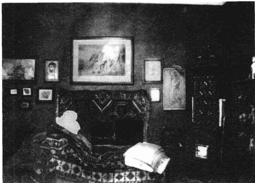
1.1 埃德蒙·恩格尔曼，Berggasse 19，诊室照片，1938年

些特别：这里到处都是艺术品，墙上和地上都被填满了，连沙发上都是。的确，这间诊室和它紧挨着的书房看起来就像是个贪婪的古董收藏家的私人博物馆。墙上、地上，还有柜子里被各种古董、雕塑和绘画塞得快要漫出来了。马克斯·波拉克（Max Pollack）画的那张生动的弗洛伊德在他办公桌后的肖像画，表现的不是一个正在全神贯注工作的学者，而是一个被周围的古代小雕像盯得悚然害怕的人。正是在这里，他将写下他对人类精神生活所作的思考。还有一张更早的弗洛伊德的照片，照片上他坐在一尊米开朗基罗的《垂死的奴隶》雕像和其他文化之旅时搜集的纪念品前（图 1.2）。这些都是他个人及在专业上对各种图像——无论是刻出来的，还是画出来的——显示出的迷恋。那么问题就来了：“为什么精神分析和图像会弄在一起？”我们也许可以回答说，精神分析正是在图像的谜题与其生动的表现中形成的。