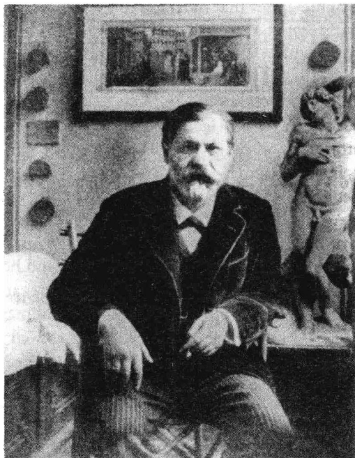
1.2 西格蒙德·弗洛伊德和米开朗基罗《垂死的奴隶》雕像合影, c. 1905

有其壳的房子里只存放了一些包括图像、书籍和手工艺品在内的室内收藏的照片复制品，正是通过这些收藏，弗洛伊德在艺术、考古学、人类学和心理学方面的爱好和职业历程，以图像画谜的方式被表现出来。 [2] 今天，我们可以到这位经历了放逐的医生在伦敦 Maresfield 花园 20 号的住所，参观一下那个被重建的维也纳式的小天地，这里的一整套家什已成为弗洛伊德博物馆内的历史文物——而博物馆本身也成为了见证精神分析创立历程的一处古迹。 [3]