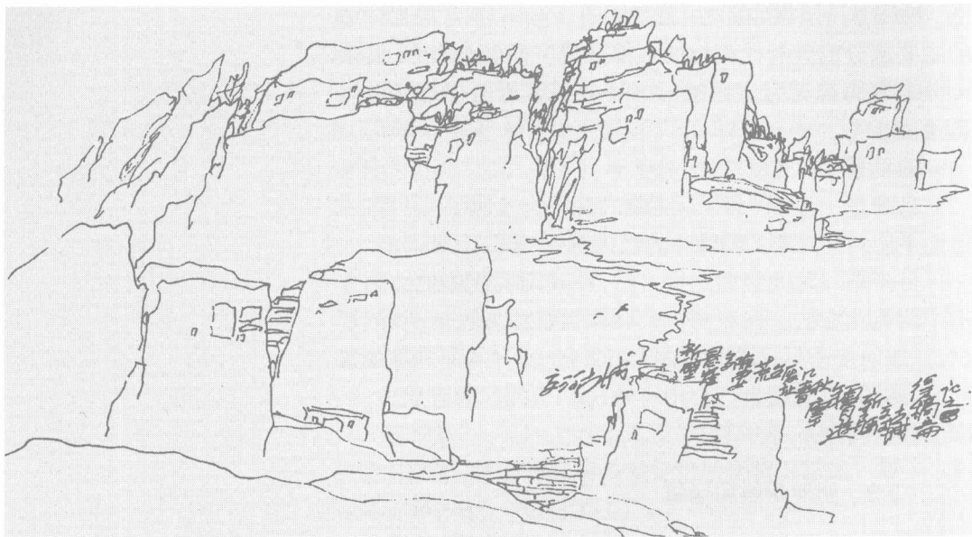
图 1-2 交河古城 史国富