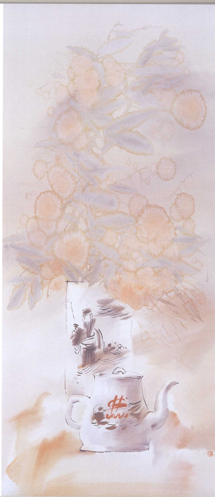
6 壶之一 纸本水彩 109cm × 47cm 2007年