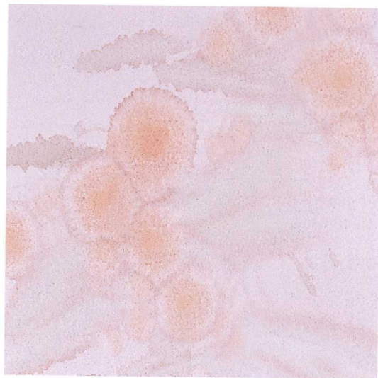
3 四季组画之四 纸本水彩 109cm × 47cm 2007年