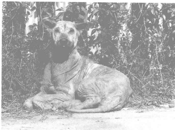
香港太埔墟车站内的狗，像是穿着宽大的中式衣服，样子非常气派。

豌豆前一阵子死了，这一团乱蓬蓬的毛线球活了十五岁。它是一只巧克力色的雄性狮子狗，凶得很，坚决不许人家帮它剪毛，结果毛越来越长，连哪里是头脸、哪里是尾巴都分不清了。往好里说，它像是一团粗毛线球，往坏里说，简直就是一个做扫除的拖把。