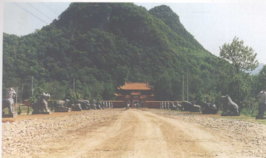
九疑山舜帝陵神道及山门