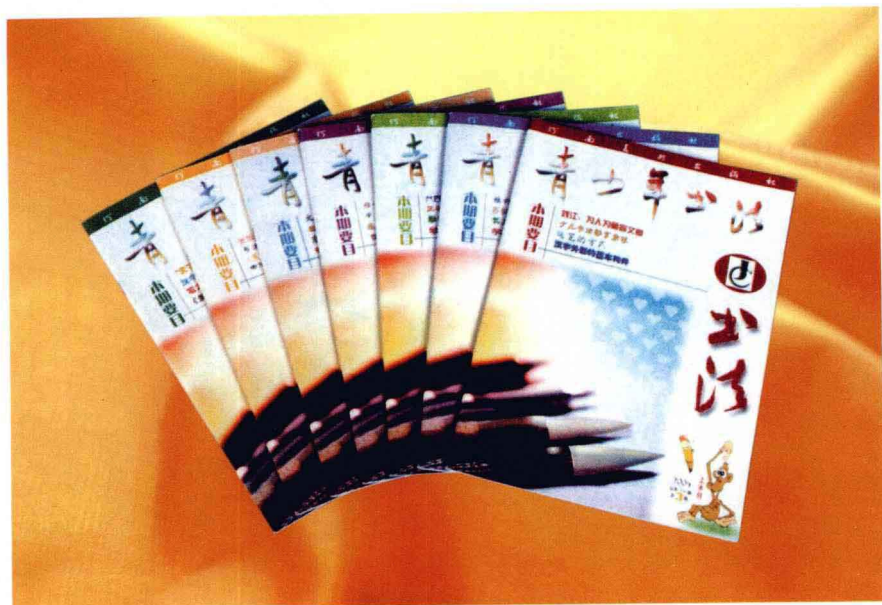
作者为《青少年书法》杂志点评学员作品