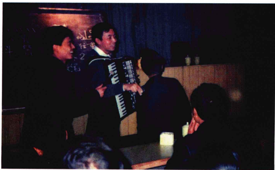
1992年2月，白武生与中国硬笔书法家协会主席庞中华在郑煤集团同台演讲钢笔书写技法。