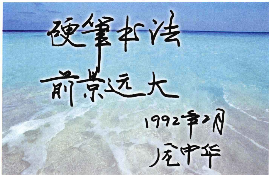
庞中华为作者题词