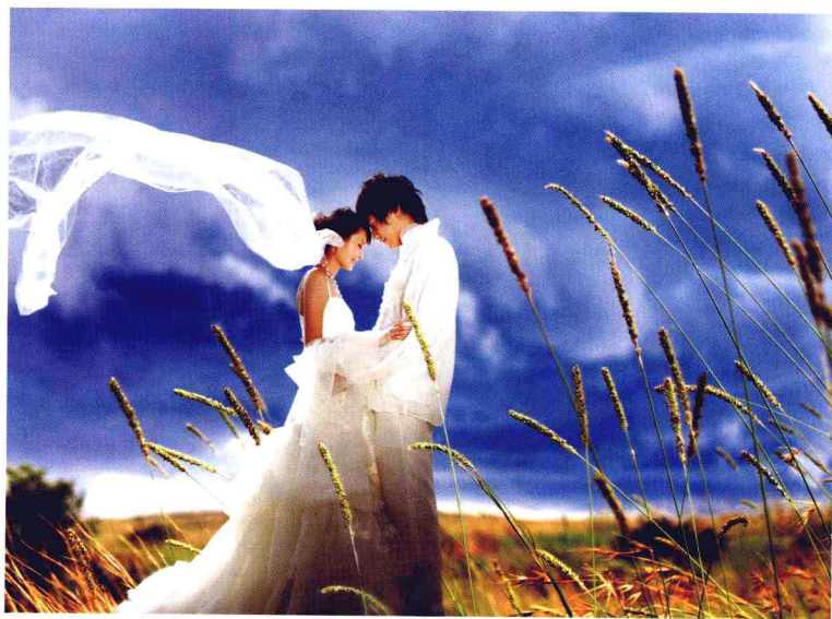
◎ 这是一幅后虚前实的时尚婚纱照，将主体表达和分层空白处理得非常完美。这也是利用相机镜头原理拍摄的成功范例。