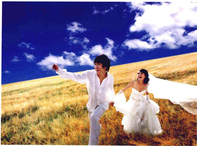
◎ 跑动抓拍的婚纱照具有浪漫的色彩。