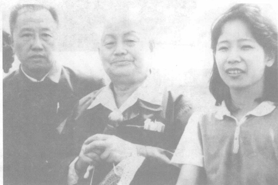
萧军与徐塞和日本萧军研究者在一起（1981年）