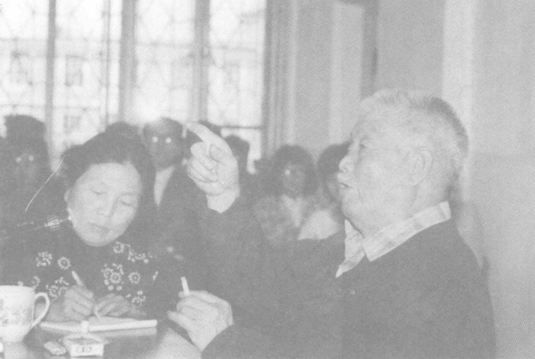
萧军在锦州师范学院 为师生讲学（1986年9月）