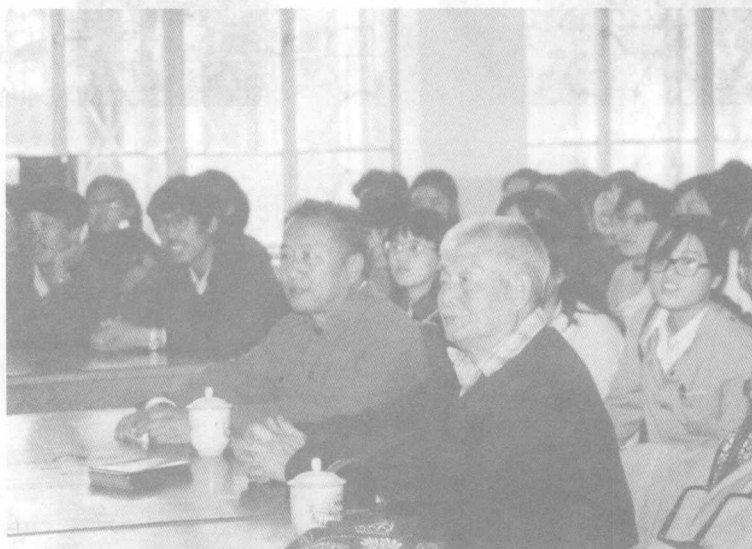
萧军与徐塞和锦州师范学 院师生座谈（1986年9月）