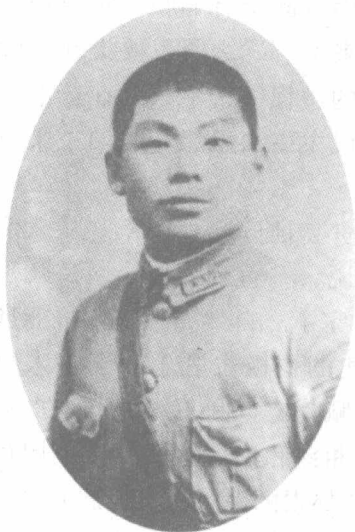
东北陆军讲武堂时的萧军

品。在一次偶然的机缘里，萧军结识了毓文中学的教员徐玉诺。他是萧军认识的第一个文学界知名的诗人，也是第一个称赞鲁迅的《野草》为真正的诗的人。在他的鼓励下，萧军开始认真读鲁迅的作品，并且对鲁迅先生产生了崇敬的心情。也就在这同时，萧军还结识了一个热爱新文学的名叫方靖远的朋友，他对后来萧军走上新文学道路起着决定性作用。当萧军正迷恋于古典诗词和旧的文学形式的时候，方靖远已经跨进了新文学的广阔领域。他阅读的是《小说月报》《学生杂志》以及一些新出版的白话小说