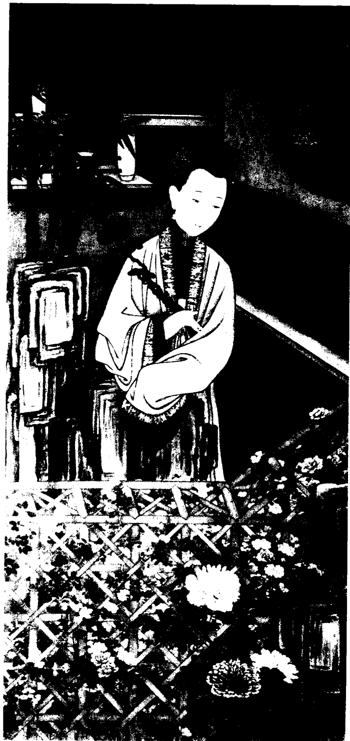
雍正妃行乐图（局部）佚名

修蛾慢脸，不语檀心一点。小山妆，蝉鬓低含绿，罗衣淡拂黄。闷来深院里，闲步落花傍。