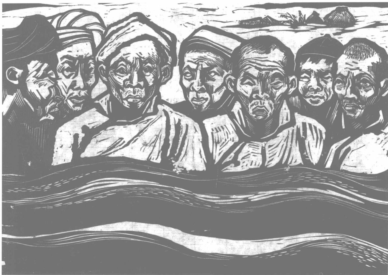
在水深火热中 (1940年) 175 × 235 mm