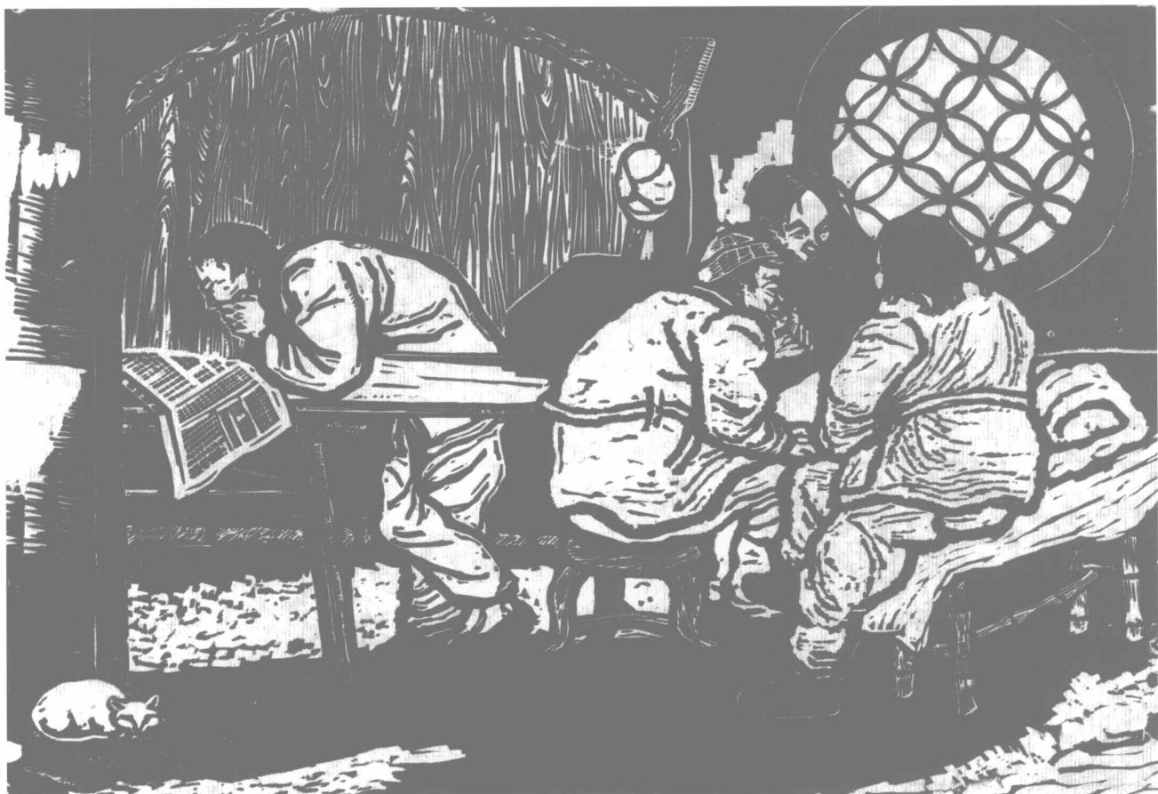
学习 (1940年) 200 × 280 mm