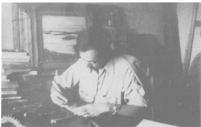
1946年在上海从事木刻创作