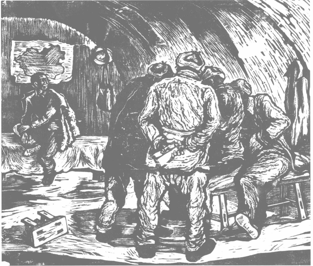
小组会 (1940年) 230 × 275 mm