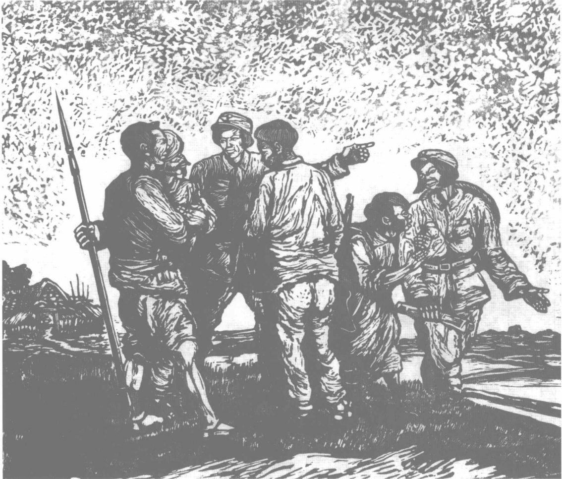
女政治员 (1940年) 250 × 280 mm