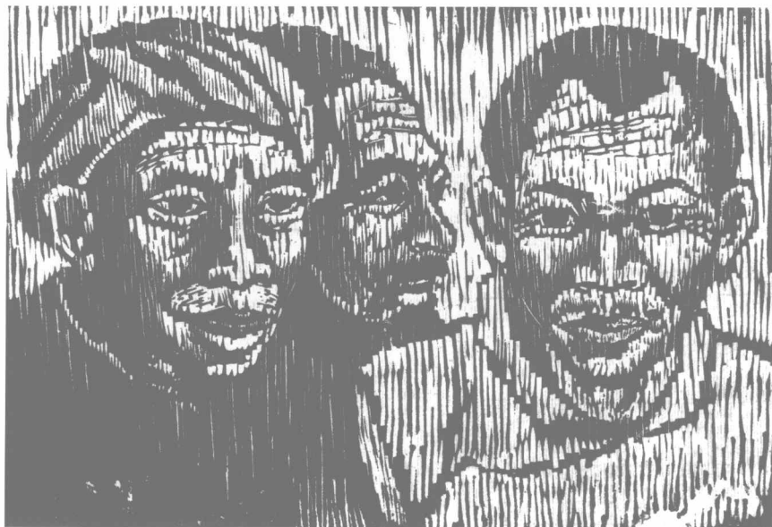
农民印象 (1941年) 180 × 250 mm