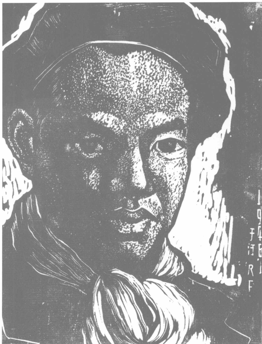
自刻像 (1940年) 200 × 150 mm