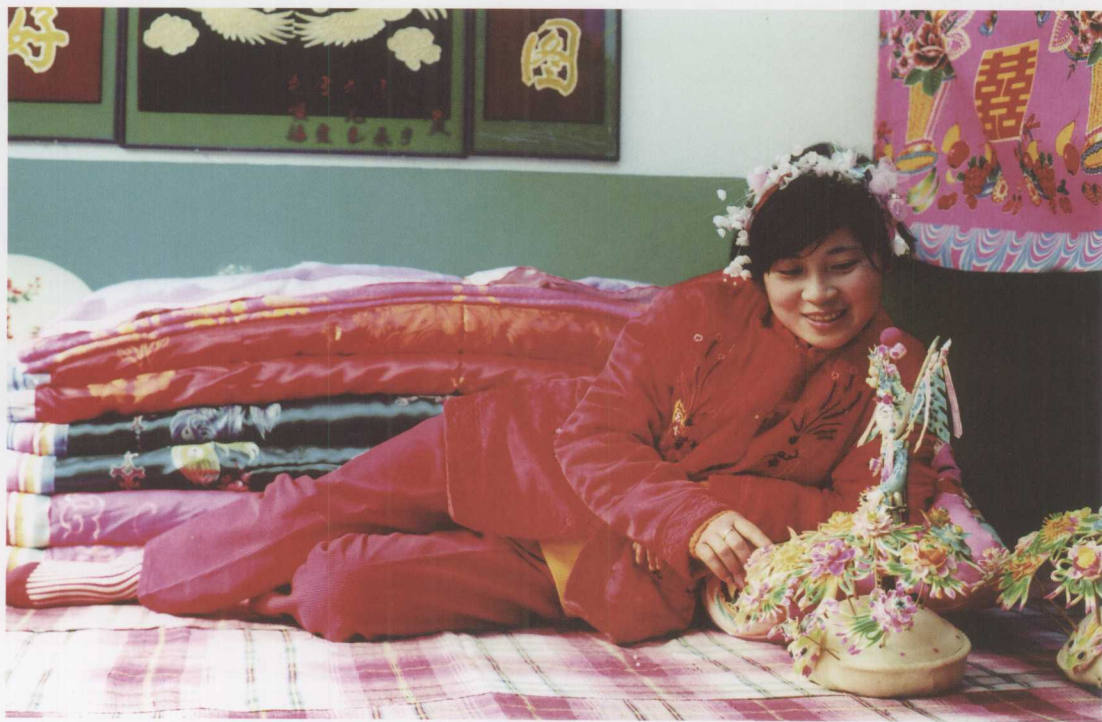
▲ 新娘子和娘家送的插花馄饨