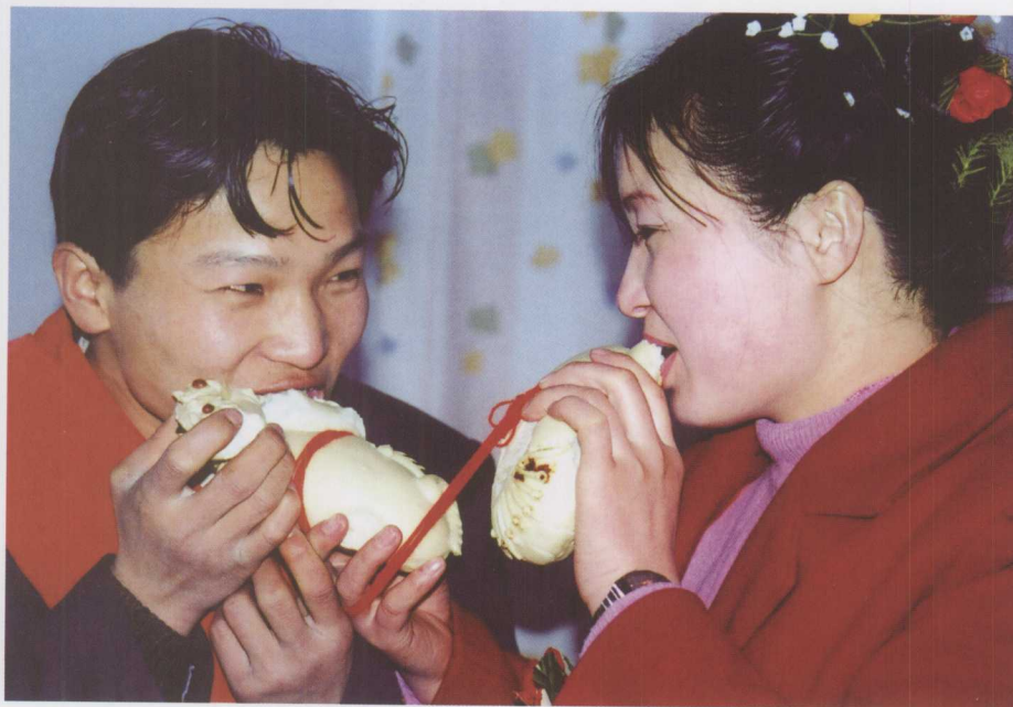
▲ 入洞房之后，新郎新娘分食线牵的小虎馍。