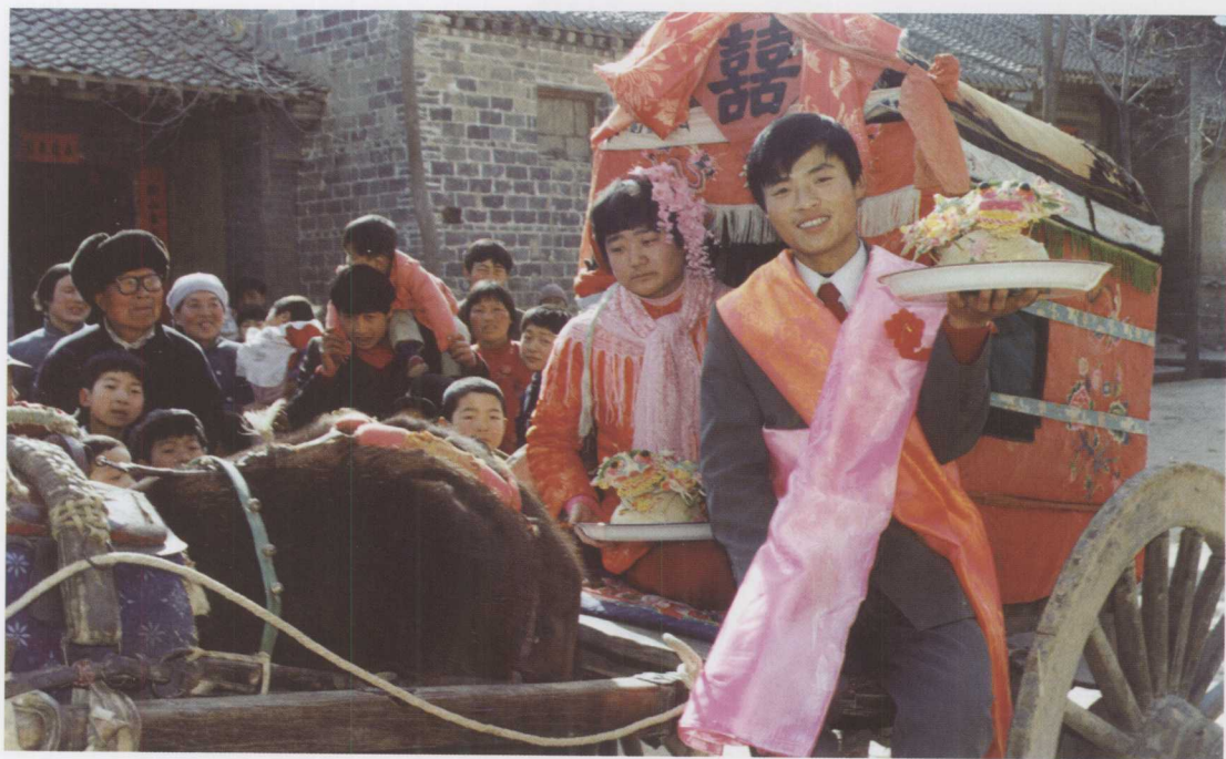
▲ 渭北合阳民风古朴，还留存着姑娘出嫁坐马拉轿车的习俗。接亲的新郎和出嫁的新娘手端娘家陪送的花馄饨坐在马拉轿车上。