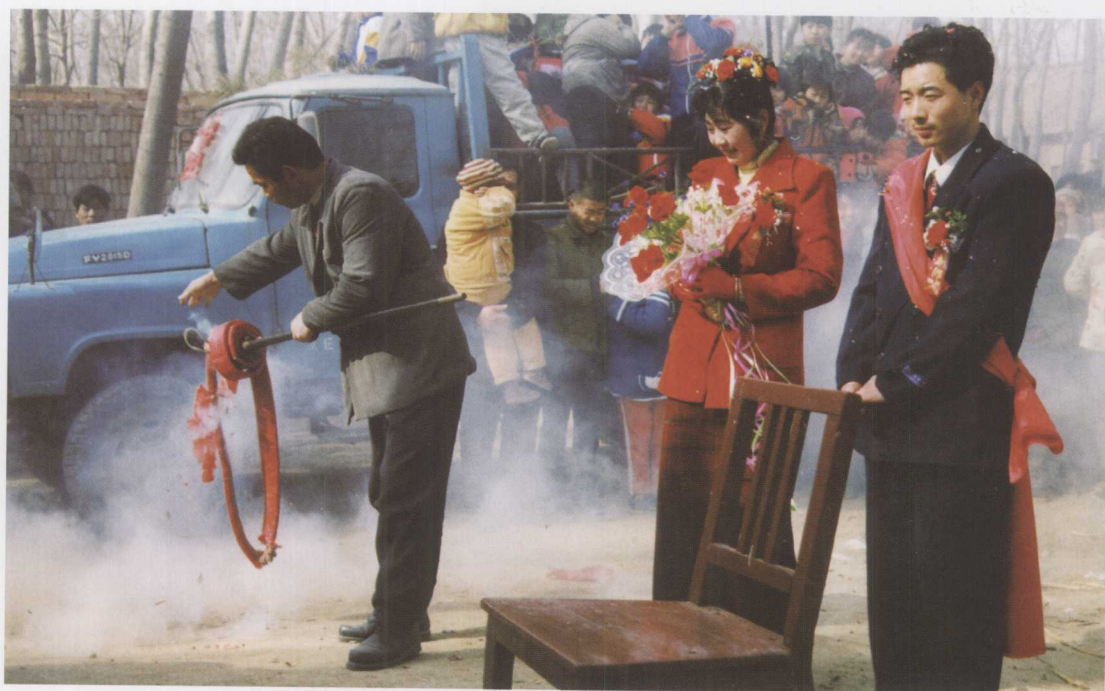
▲ “秤头上挂鞭炮”象征着这桩婚事称心如意、和和美美。