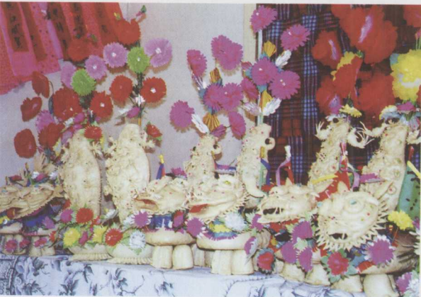
◀ 渭北大荔农村婚礼喜堂上摆放的寓意平安的“花瓶”面花和寓意生机的老虎糕。

▶ “高馍盘”是面花中最为壮观的一种，专门用于农村的结婚庆典。男方姑、姨、舅家馈赠的高盘大礼馍，要用近百斤优质面粉蒸制而成。个个花纹造型自然美观，层层有寓意，组装盘绕为“龙柱”。