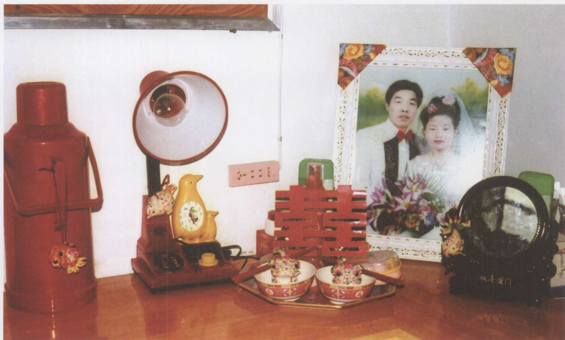
▲ 渭北农村结婚时娘家给女儿送的各种嫁妆及生活用品，上面都有用红线牵挂着的各种动物造型的小花馍。