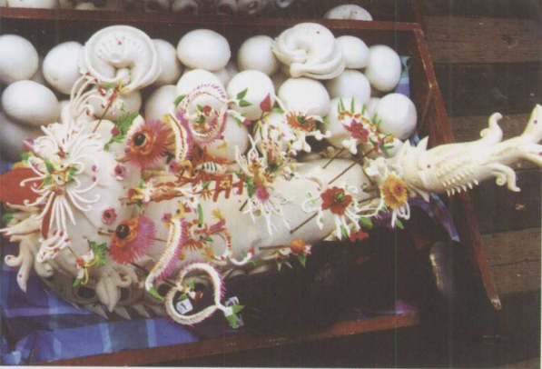
◀ 食盒中的结婚礼馍