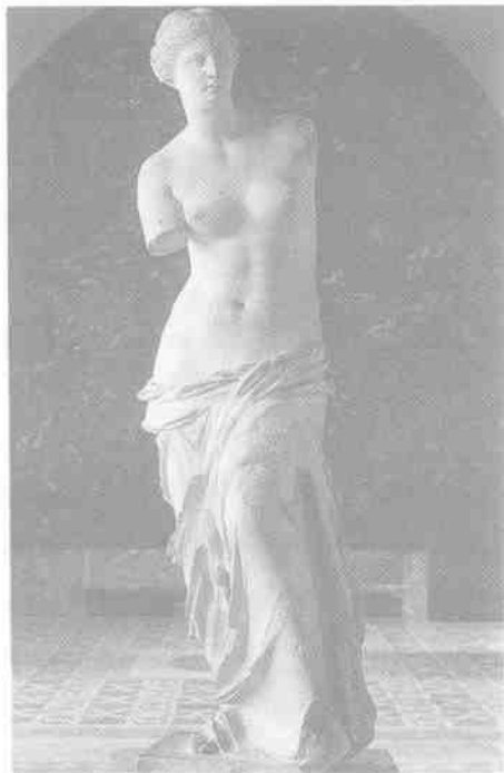
1-1 米洛斯的維納斯 公元前2世紀 大理石 高204cm 巴黎：羅浮宮

緒論部分主要講三個問題，一是概述了美學由審美意識的產生，經美學思想、觀點的發展和積累，到成為一門獨立學科的歷史過程；二是從古代偏於客觀的美學，經近代偏於主體的美學，向主客體辯證統一發展的必然趨勢，論證審美關係作為