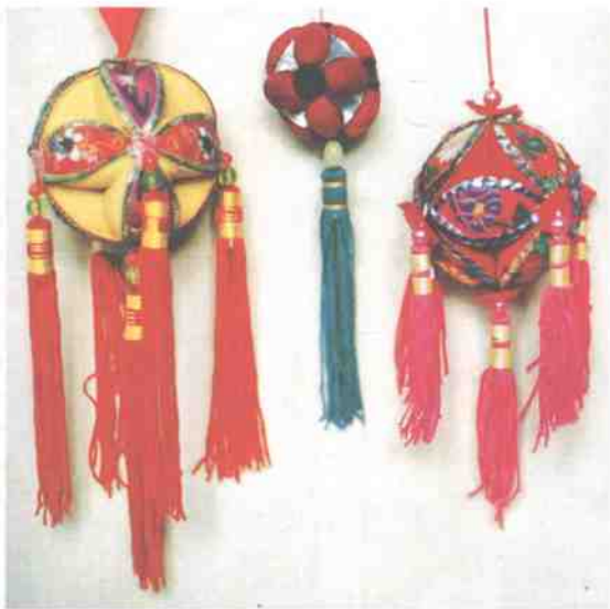
▲左:广西桂林绣球(硬面),中:河南民间小绣球(软面),右:广西绣球。