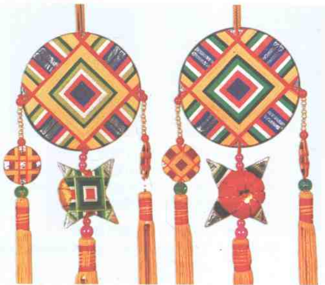
▲缠线古钱(设计制作:李德慧)