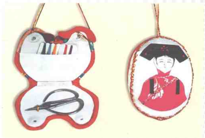
▲ 左:打开的鸳鸯针线荷包,右:布贴人物针线荷包。