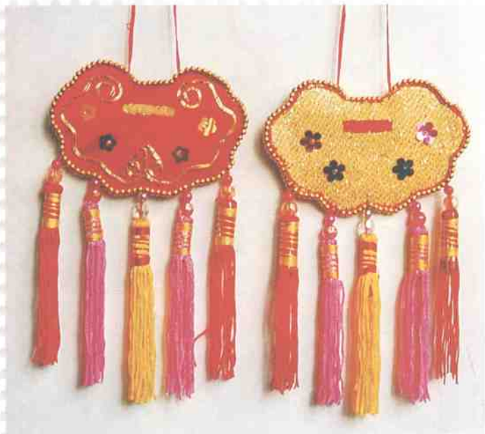
▲ 长命锁香包(象征“长命富贵”)