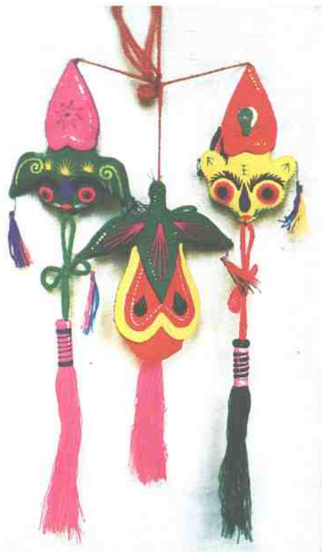
▲ 左上、右上:虎头针线荷包, 中下:石榴针线荷包。