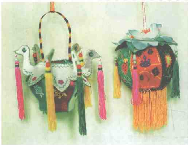
▶ 左:百鸟绣花篮,右:荷花绣灯笼。