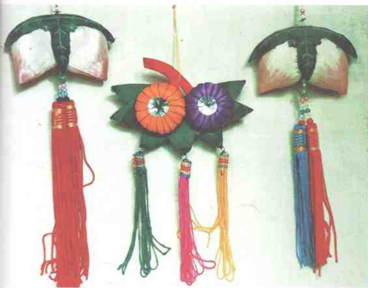
▲左、右:双寿桃香包,中:双柿香包(象征:“事事如意”)。