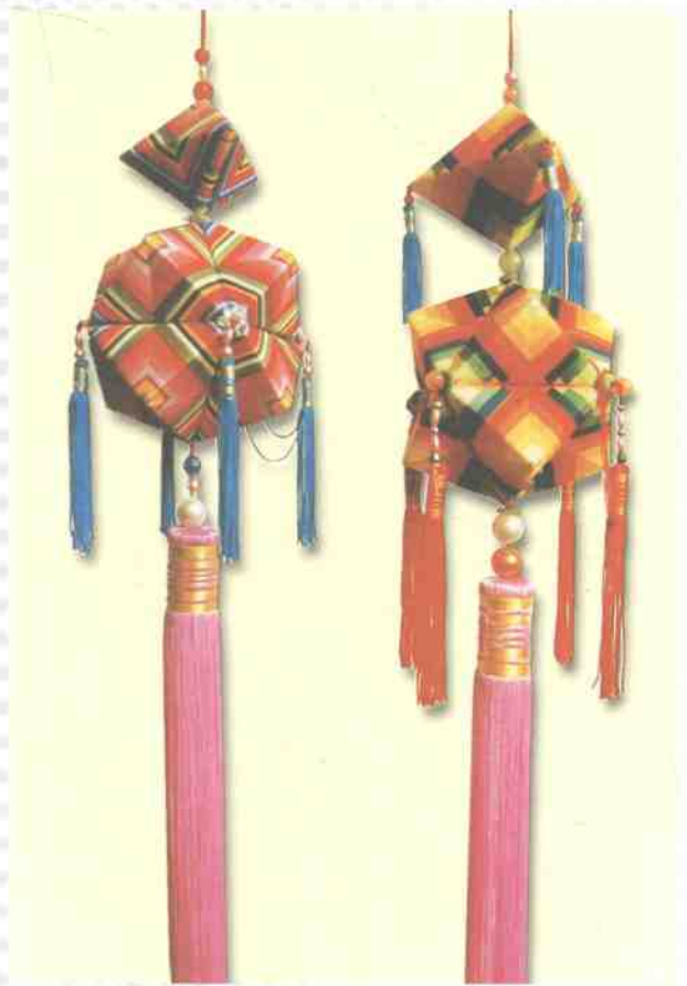
▲ 彩棕球(设计制作:李德慧)