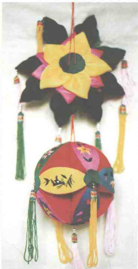
▲ 广西旧州绣球 在球面运用了手绣工艺。