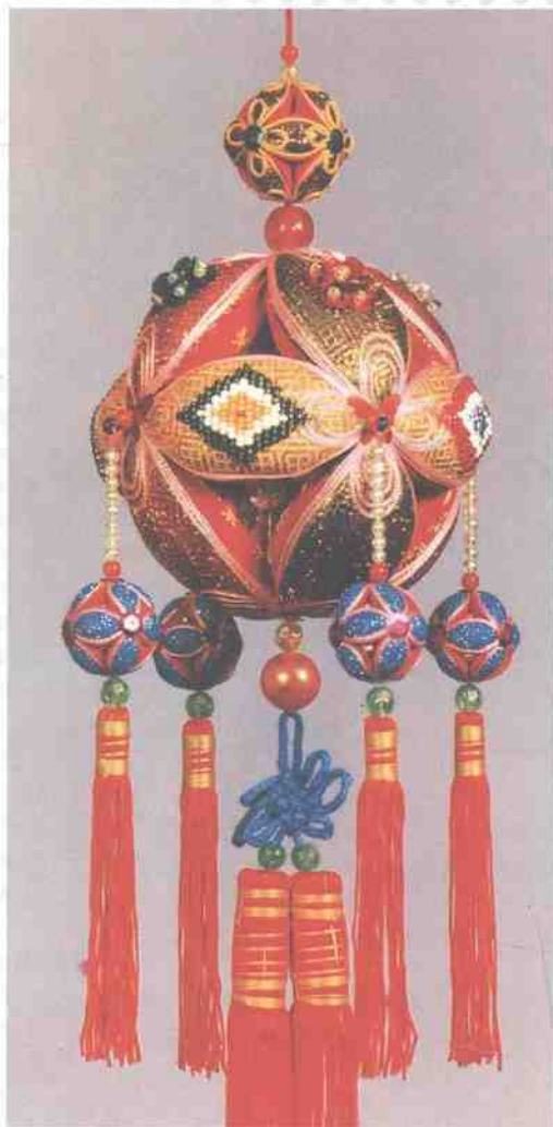
► 珠绣彩球(设计制作:李德慧)